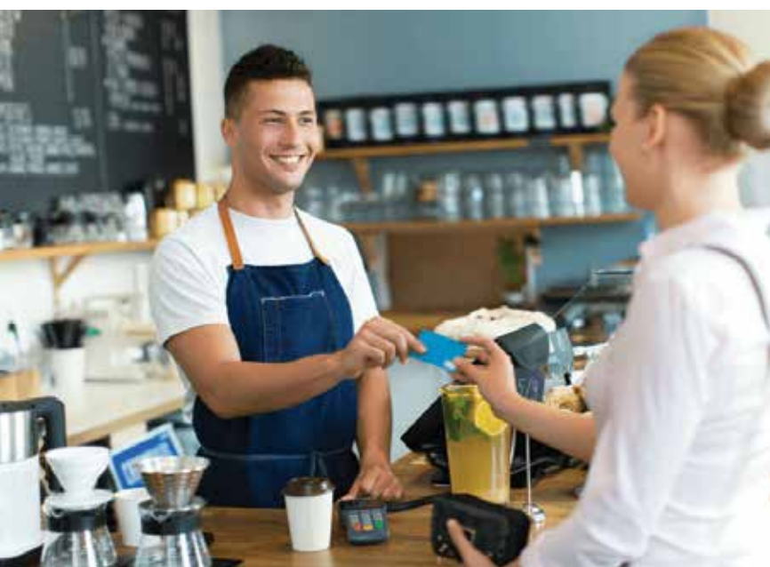
Essas empresas não deixaram seus clientes sem resposta ou esperando mais tempo por um retorno.

Mas o que elas fizeram de diferente? Mesmo com um volume de tickets pelo menos 10% maior do que antes, essas empresas não deixaram seus clientes sem resposta ou esperando mais tempo por um retorno. Conheça algumas das boas práticas que implementaram abaixo, e confira o levantamento completo em nosso blog da Zendesk Brasil.