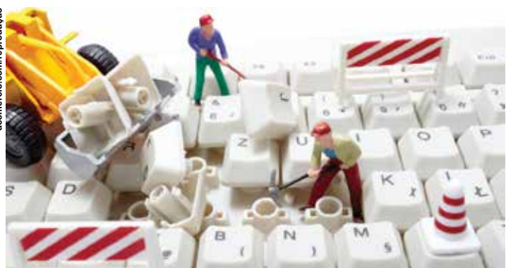
Não existe fórmula ou mágica para que os negócios voltem com a mesma potência.

“O governo concedeu 3 meses de suspensão dos contratos para as empresas passarem pela quarentena, mas o