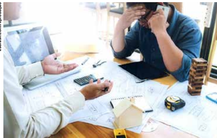
A trajetória crescente do endividamento já era observada antes da crise.

Por outro lado, aumentou a proporção de famílias com dívidas a vencer no prazo de 6 meses a 1 ano, assim como aquelas acima de 1 ano. Com mais consumidores endivida-