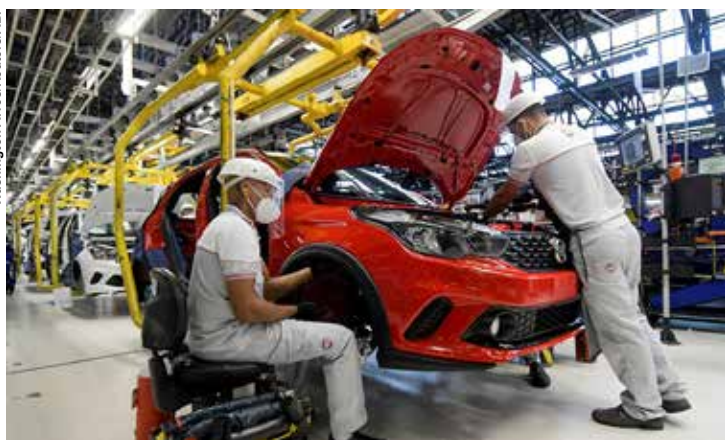
A alta foi puxada em especial pela produção de veículos automotores, reboques e carrocerias.

Os dados são da Pesquisa Industrial Mensal, divulgada ontem (4), pelo IBGE. Apesar da alta de maio para junho, a produção apresentou queda de 9% na comparação com junho de 2019. Houve ainda recuos de 10,9% no acumulado do ano e de 5,6% no acumulado de 12 meses. A alta foi puxada por 24 das 26 atividades industriais pesquisadas, em especial pela produção de