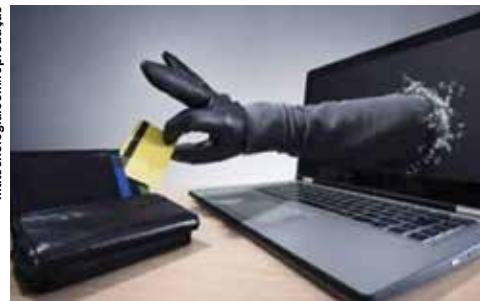
Com o crescimento das compras aumentaram as tentativas de fraudes.

Por isso, é importante que os consumidores fiquem atentos aos links