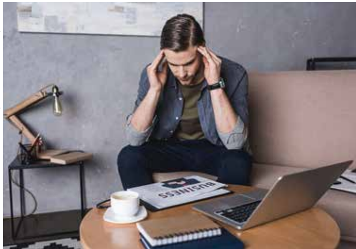
Gestores devem traçar planos para auxiliar na manutenção e proteção da saúde psicológica dos colaboradores.

Foi neste contexto que o Rocha, Marinho E Sales Advogados – um dos maiores e mais tradicionais escritórios da região Nordeste e Centro-Oeste, com foco em advocacia corporativa – realizou o seu primeiro trabalho com a House Of Feelings (HOF) – consultoria especializada em auxiliar empresas com os sentimentos de seus colaboradores. O treinamento faz parte do projeto RMS Talks, que reúne os colaboradores em