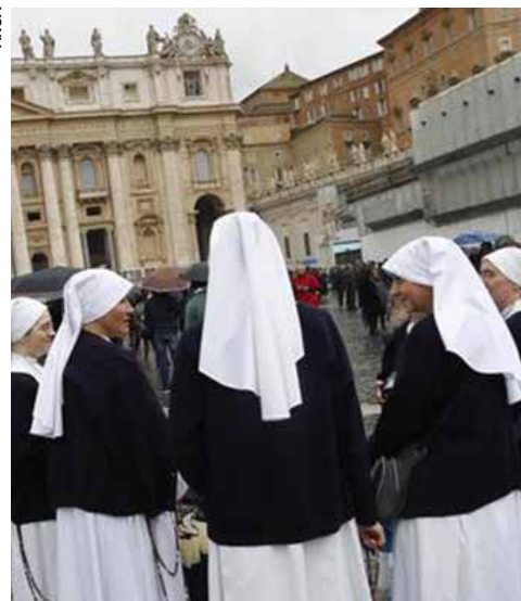
Grupo de freiras na Praça São Pedro, Vaticano.

Em entrevista ao suplemento mensal “Donne Chiesa Mondo”, do jornal vaticano “L'Osservatore Romano”, Aviz disse que esse fenômeno permanecia “escondido”, mas deverá “sair à luz”. “O Vaticano está investigando casos de