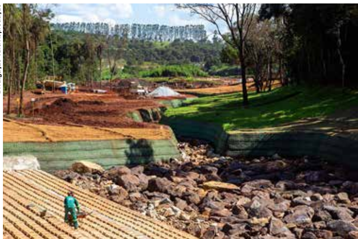
Estragos provocados pela lama não serão reparados em curto prazo.

Foi somente na semana passada que foi detalhado