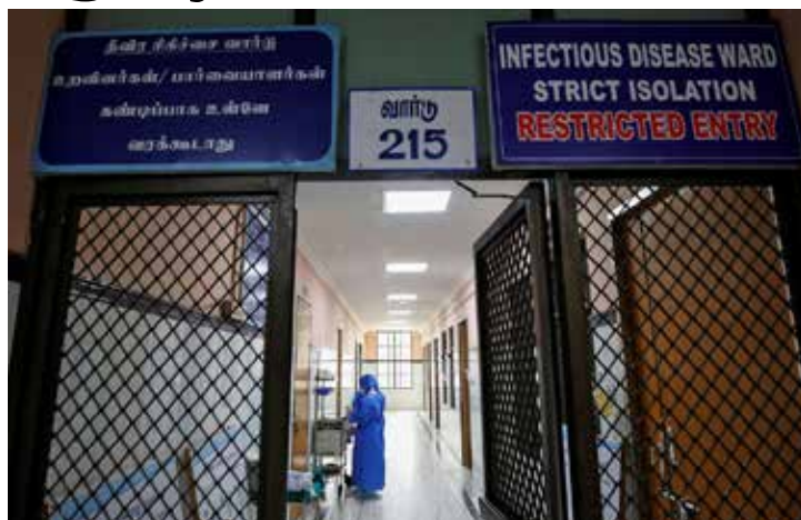
O laboratório da farmacêutica Inovio, em San Diego, na Califórnia, é um dos locais onde a vacina está sendo desenvolvida.

O fato de as autoridades chinesas terem sido rápidas