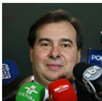
Presidente da Câmara dos Deputados, Rodrigo Maia.

Para Maia, os estrequecimentos que abalaram a relação com o presidente Jair Bolsonaro já foram resolvidos. Ele acrescentou, ainda, que as eleições municipais não deverão atrapalhar os planos do governo. A previsão que apresentou é a de