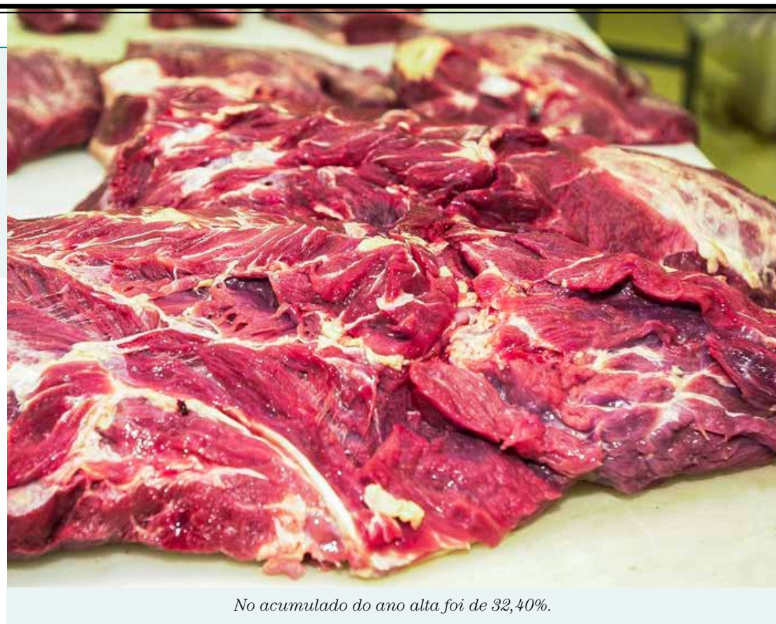
No acumulado do ano alta foi de 32,40%.

“A carne tem um efeito grande na parte de alimentação fora do domicílio, porque gera uma inflação de custos para bares e restaurantes, assim como, tem efeito também em outras proteínas e alimentos, como no caso dos pescados e frangos