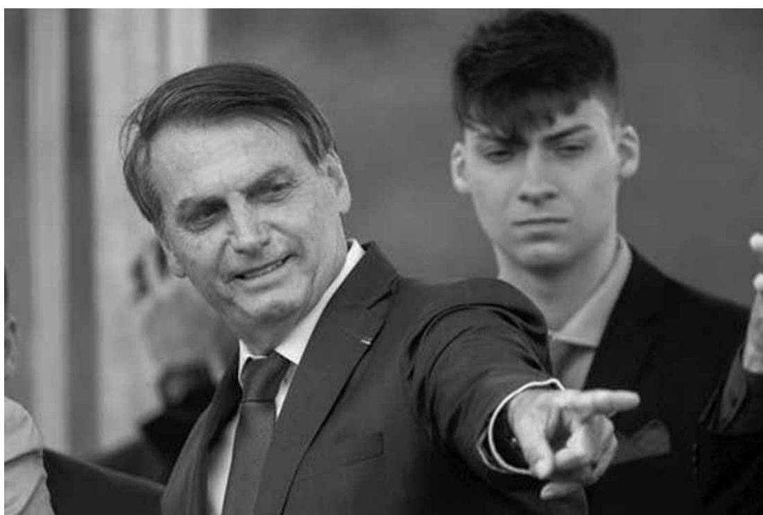
É impressionante a imprensa dar espaço para uma pirralha dessa aí", afirmou Bolsonaro.

"Indígenas estão sendo mortos por tentar proteger a floresta do desmatamento ilegal. De novo e de novo. É uma vergonha que o mundo permaneça calado sobre isso", afirmou. A declaração