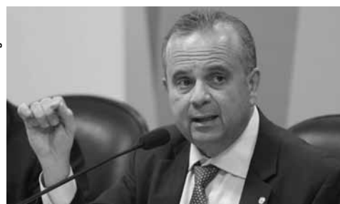
Secretário especial de Previdência, Rogério Marinho

Agora será possível usar geradores no interior de construções de forma a manter o funcionamento das empresas. As regras de quantidade de tanques para armazenamento de diesel foram flexibilizadas, mas a norma limita o volume desses tanques de acordo com os padrões internacionais, com exigências de segurança para prevenir acidentes.