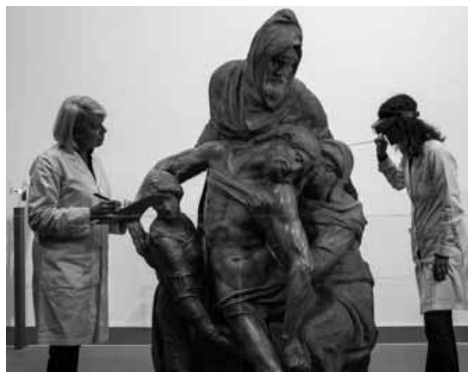
Pietà de Florença passará por processo cuidadoso de limpeza.

A escultura retrata o corpo de Cristo sustentado por Nicodemo, abraçado pela Virgem Maria e, à esquerda, Maria Madalena. No rosto de Nicodemo, o artista fez seu autorretrato. “Estamos todos emocionados, é uma obra