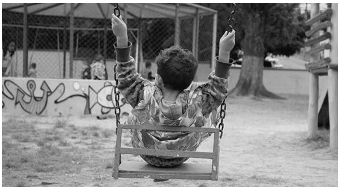
Brincar é a principal atividade da infância.

1. - Escolha a natureza - Os parques e praças são bons lugares para explorar a natureza, o espaço livre. Oferecem à criança uma gama de materiais, possibilidades