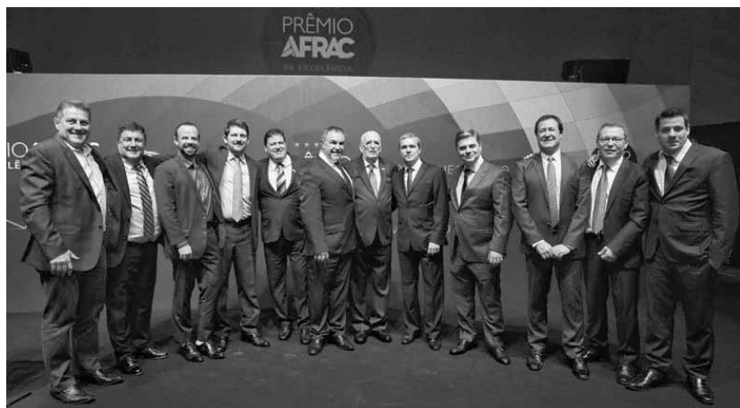
Os vencedores do Prêmio AFRAC de Excelência 2019.

Outro destaque da premiação, com a vitória em três categorias, foi a Gertec Brasil. “Esse é o resultado de anos de dedicação de centenas de funcionários, que trabalharam duro por todo esse tempo para conquistarmos esse prêmio de uma associação