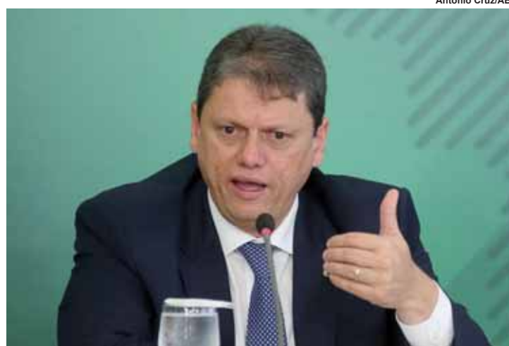
Ministro da Infraestrutura, Tarcísio Gomes de Freitas.

A infraestrutura brasileira poderá se beneficiar da queda das taxas de juros de outros países. Na avaliação do ministro da Infraestrutura, Tarcísio Gomes de Freitas, esse cenário representará uma janela de oportunidades para que o país acabe se tornando uma opção mais rentável para investidores estrangeiros. Mas para que isso aconteça, é fundamental que o país continue apresentando projetos “organizados, sofisticados” e dentro de uma estratégia bem planejada.