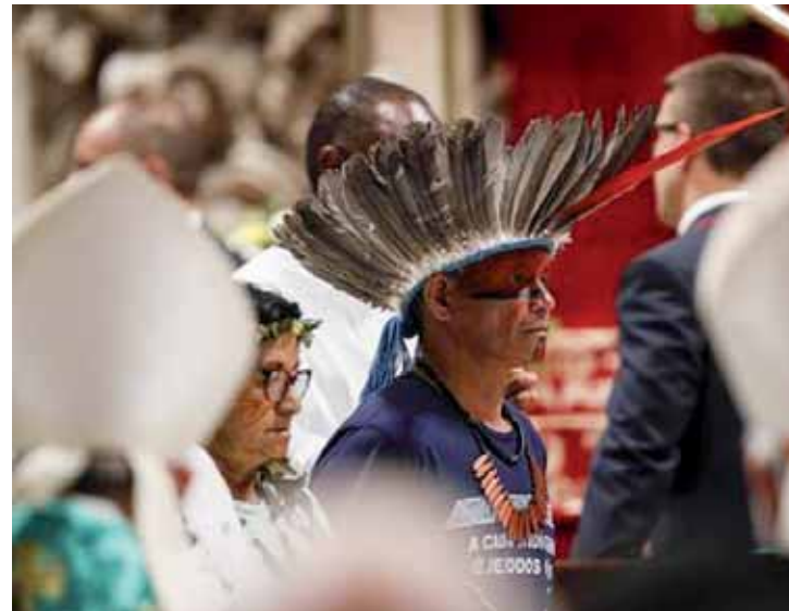
Assembleia prevê a extensão do sacerdócio aos chamados “viri probati”, homens casados.

O bispo emérito do Xingu, Erwin Kräutler, afirmou ontem (9) que a ordenação de homens casados como padres, é a única alternativa para garantir a presença da Igreja Católica na Amazônia. Essa é uma das propostas mais polêmicas em discussão no Sínodo dos Bispos dedicado à maior floresta tropical do planeta e já provocou até acusações de heresia por parte do clero ultraconservador.