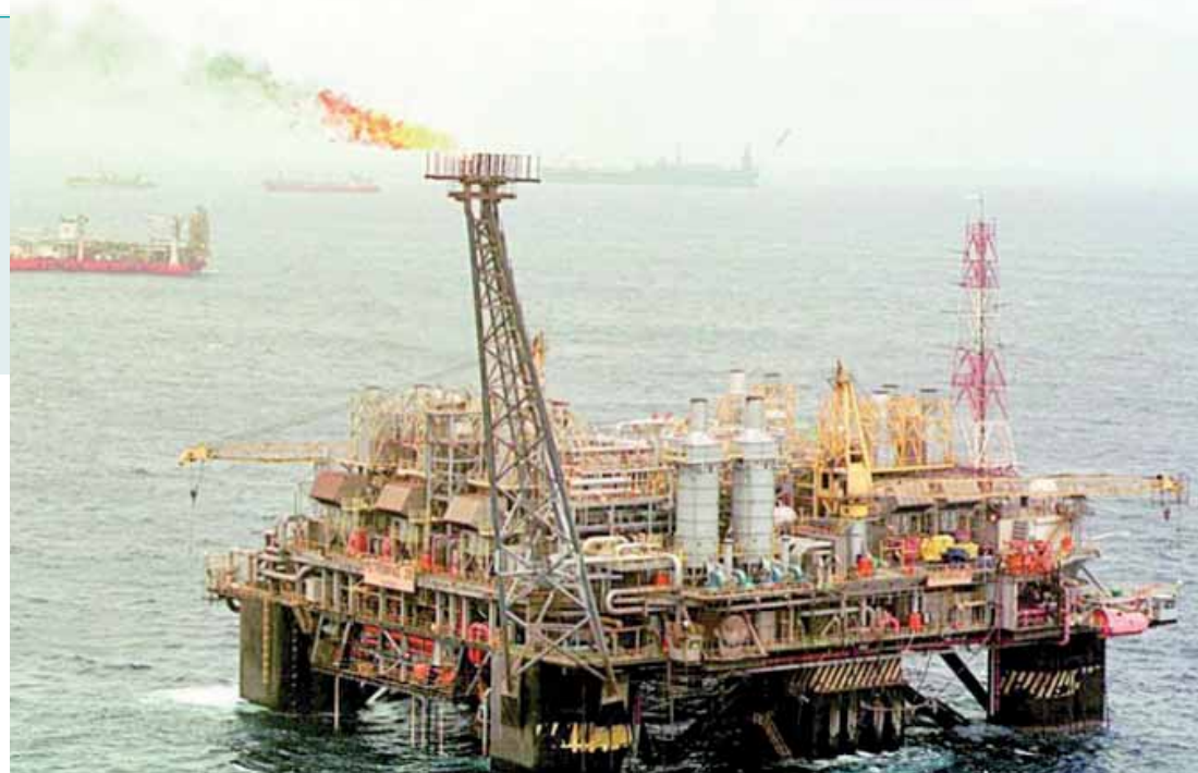
A norma era questionada no Supremo desde 2012 pelo estado do Espírito Santo.

O Artigo 20 da Constituição assegura participação nos resultados da exploração de petróleo a todos os estados e municípios em cujo território se dá a atividade exploratória. A Lei 7.990/1989, contudo, prevê a redistribuição de 25% dos royalties que cabem aos estados para todos os municípios