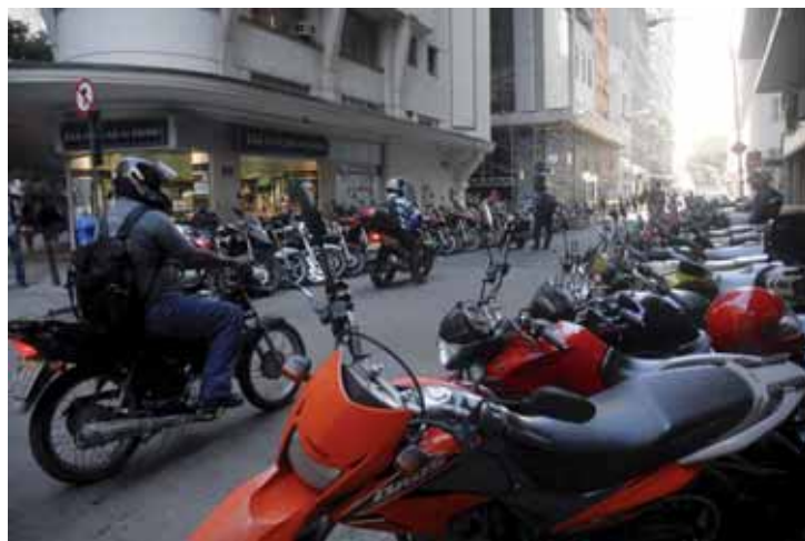
No acumulado do ano foram vendidas 816.064 motocicletas no atacado, volume 14,7% superior ao mesmo período de 2018.

Segundo o balanço mensal da entidade, as vendas para as concessionárias totalizaram 95.282 unidades, resultando em um aumento de 24,2% em relação ao mesmo mês do ano passado, de 76.695 unidades, e queda de 9% na comparação com agosto, de 104.649 unidades. No acumulado do ano foram vendidas 816.064