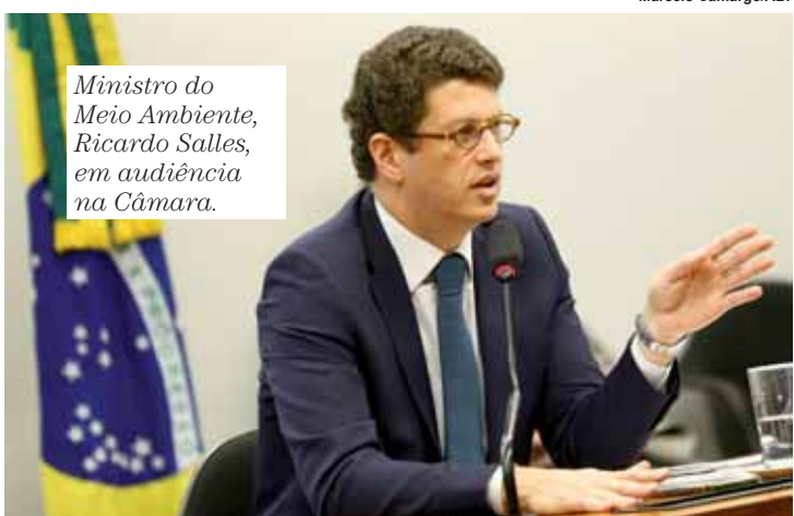
Ministro do Meio Ambiente, Ricardo Salles, em audiência na Câmara.