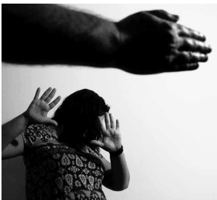
Independência financeira não é garantia de proteção às mulheres contra a violência doméstica.

“Uma das conclusões é que o empoderamento econômico da mulher, a partir do trabalho fora de casa e da diminuição das discrepâncias salariais, não se mostra suficiente para superar a desigualdade de gênero geradora de violência no Brasil”. De acordo com o estudo, outras políticas públicas se fazem necessárias