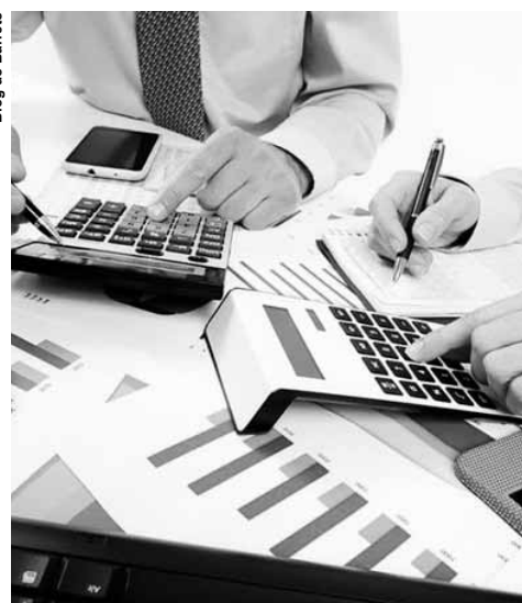
Nessa seara, a contabilidade é um dos fatores decisivos para o sucesso da iniciativa.

É quando as receitas são adequadas aos gastos, constituído basicamente pelo orçamento de arrecadações e gastos do ano, balanço este que não incorpora as mesmas premissas do modelo de relatório baseado nos padrões de demonstrações contábeis internacionais.