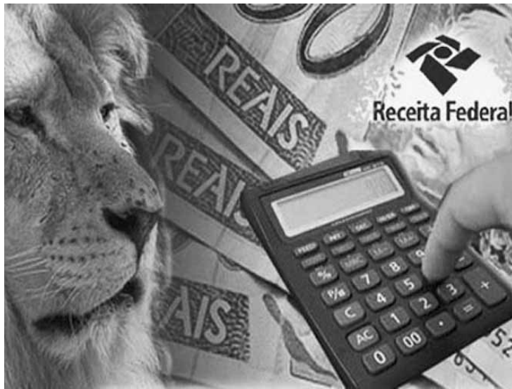
A Receita identifica "inconsistências" cruzando informações eletrônicas.

A Receita orienta as empresas com irregularidades no IRPJ e na CSLL dos anos-calendário seguintes a se autorregularizarem. Em junho de 2019, serão iniciadas as ações referentes ao ano-calendário 2015, com envio de cartas para mais de 14 mil empresas que apresentam inconsistências nos recolhimentos e declarações de IRPJ e CSLL de aproximadamente R$ 1,5 bilhão.