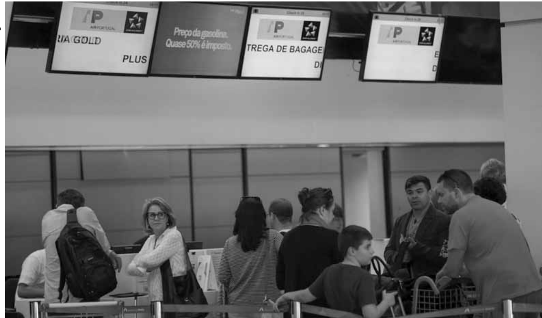
O dólar mais caro está levando à redução dos gastos de brasileiros no exterior.