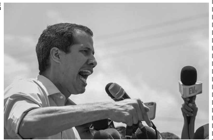
Guaidó disse que aceitou o convite do país nórdico e pediu que Caracas tenha "eleições livres".

"Reiteramos nosso compromisso de continuar apoiando a procura por uma solução comum entre todas as partes da Venezuela", informou o Ministério das Relações Exteriores da Noruega. Em um documento escrito pelo autoproclamado presidente da Venezuela, Guaidó disse que aceitou o convite do país nórdico para "explorar uma possível saída negociada da ditadura e desta grave crise".