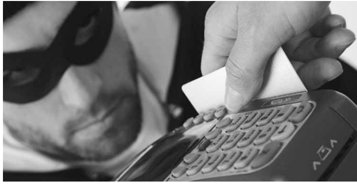
A maior parte de fraudes cometidas nos últimos 12 meses, está ligada à clonagem de cartão de crédito.

Já o segundo golpe mais comum observado pelo estudo é o recebimento de boletos falsos, com 13% das menções. Além desses tipos de fraudes, também aparecem clonagem de cartão de débito, contratação de empréstimos e financiamento, todos com o mesmo nível de incidência (11%), respectivamente. De acordo com o levantamento, metade (48%) das fraudes se