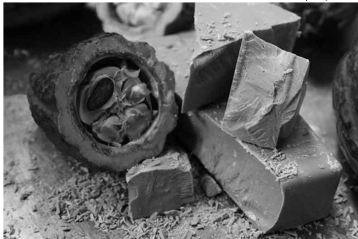
Empresas lançarão produtos próprios à base do cacau Ruby.

Reconhecido no mundo como a grande tendência para este ano, o chocolate rosa chegou na quinta-feira (31) às lojas do Brasil. Apresentado como uma intensa experiência sensorial, o chocolate ruby foi descoberto pela empresa suíça Barry Callebaut, uma das maiores processadoras de cacau do mundo.