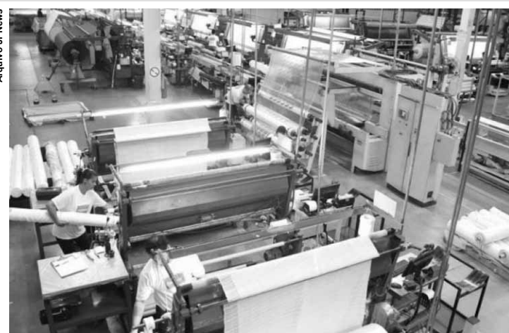
O setor industrial dá sinais de esperar uma retomada nos próximos meses.

O Índice da Situação Atual, que mede a confiança dos empresários da indústria em relação ao momento presente, subiu 1 ponto, indo para 97 pontos, a terceira alta