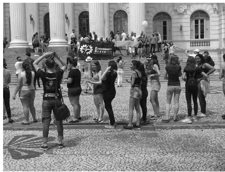
A ideia é se inscrever no que realmente deseja trabalhar. A universidade é o período em que se vai estudar para ter uma profissão.