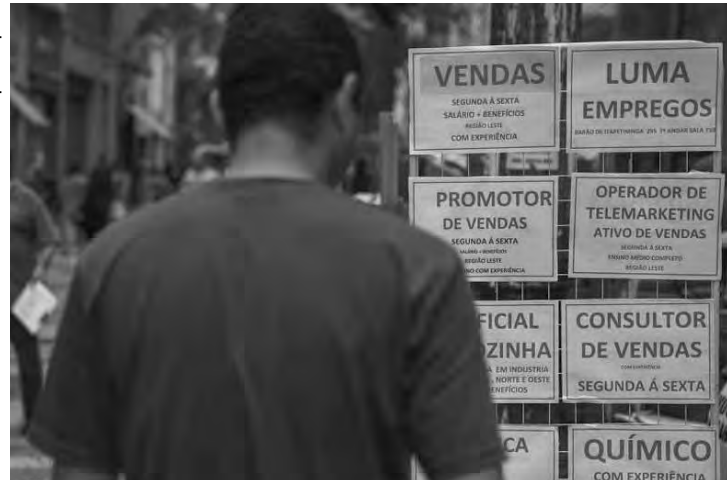
A população ocupada, de 93,2 milhões, é a maior da série histórica, iniciada em 2012.

A população ocupada, de 93,2 milhões, é a maior da série histórica, iniciada em 2012. O número de pessoas empregadas é 1,2% maior (mais 1,1 milhão de pessoas) que agosto e 1,3% maior (mais 1,2 milhão de pessoas) que novembro do ano passado. A taxa de subutilização da força de trabalho ficou em 23,9%, ou seja, 0,5 ponto percentual abaixo de agosto (24,4%) e estatisticamente igual à de novembro de 2017 (23,7%). A taxa incluiu os desocupados, aqueles que trabalham menos do que poderiam (subocupados por insuficiência de horas) e pessoas que não