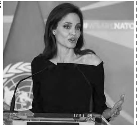
Estrela é ativista em questões de refugiados e violência sexual.