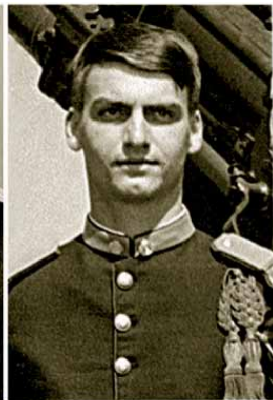
Hermes da Fonseca, Eurico Dutra e Jair Bolsonaro: militares escolhidos para a Presidência pelo voto popular.

Na visão dele, qualquer fardado que chegasse à Presidência transformaria o Brasil numa ditadura, tal qual haviam feito os marechais Deodoro da Fonseca e Floriano Peixoto. Hermes, por sinal, era sobrinho de Deodoro.