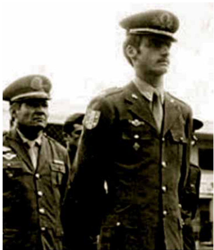
Jair Bolsonaro nas fileiras do Exército.

Enquanto Dutra encerrou o mandato com a popularidade nas alturas, Hermes saiu excedido do Catete. Seu governo foi marcado por um truculento estado de sítio, pela execução dos rebeldes da Revolta da Chibata e pela intervenção federal em diversos estados, com a derrubada de governadores e o bombardeio de Salvador.