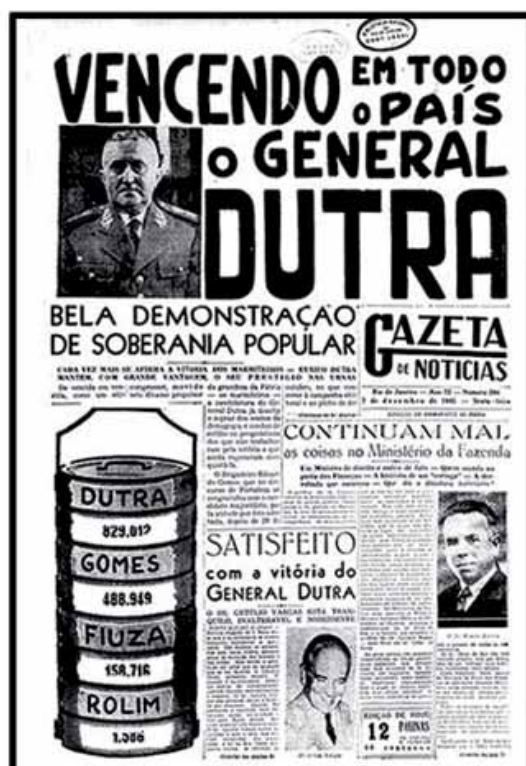
Imprensa noticia posse do marechal Hermes, em 1910, e vitória do general Dutra, em 1945: Militares que chegaram à Presidência pelo voto popular.