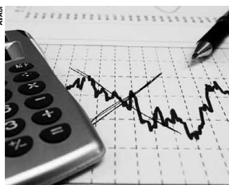
Para o mercado financeiro, a Selic deve permanecer em 6,5% ao ano.

A meta de inflação, que deve ser perseguida pelo BC, é 4,5% este ano. Essa meta tem limite inferior de 3% e superior de 6%. Para 2019, a meta é 4,25% com intervalo de tolerância entre 2,75% e 5,75%. Já para 2020, a meta é 4% e 2021, 3,75%, com intervalo de