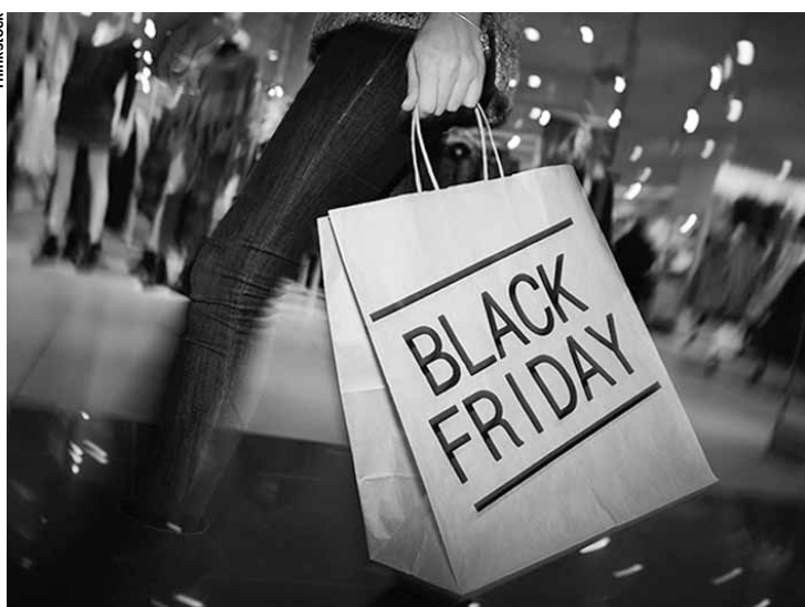
Consumidor está disposto a gastar mais no evento deste ano.

Por outro lado, 32% só devem ir às compras caso encontrem boas ofertas e apenas 10% não pretendem comprar nada. Entre os que pretendem comprar produtos de olho nos descontos, 70% consideram a data uma oportunidade de adquirir itens que estejam precisando com preços mais baixos. Cerca de 30% querem antecipar os presentes de Natal de olho nas promoções, enquanto 12% planejam aproveitar as ofertas mesmo sem