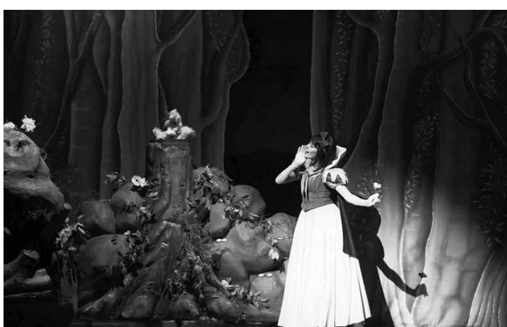
Cena do musical “Branca de Neve”.

“Branca de Neve – O Musical”, adaptado da clássica história da menina “branca como a neve, cabelos negros como ébano e lábios vermelhos como o sangue”, é mais uma produção dos mesmos realizadores de Cinderella, A Bela e a Fera, Pinocchio – O Musical, Peter Pan, Natal Mágico e O Mágico de Oz. Inspirada no conto do livro original dos Irmãos Grimm, e com direção geral de Billy Bond, musical já encantou quase 300 mil espectadores, após passagens pela Argentina, Chile e Peru. Os diálogos e músicas são entoados em português, além de muitos efeitos especiais, 4D e leds de altíssima definição. A montagem tem ainda recursos de gelo seco, levitações, ilusionismo e equipamentos que