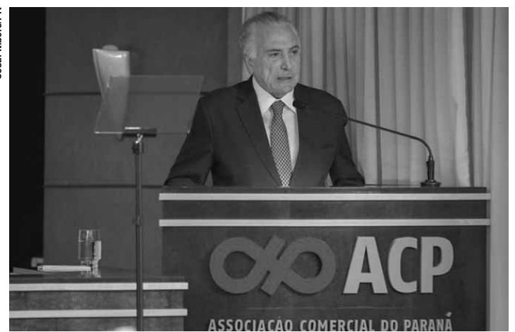
Temer faz palestra na Associação Comercial do Paraná, em Curitiba.

"Faltaram [para meu governo] as reformas da Previdência e a tributária. São duas reformas que eu completaria se não fosse uma trama montada lá atrás para me impedir de levar a reforma da Previdência. Naquele período, tínhamos os votos contados para aprovar a da Previdência, mas houve uma trama que impediu exatamente por conta dos privilégios", disse o presidente. Segundo ele, a reforma da