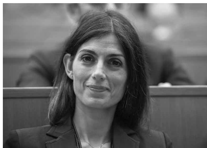
A prefeita de Roma, Virginia Raggi.