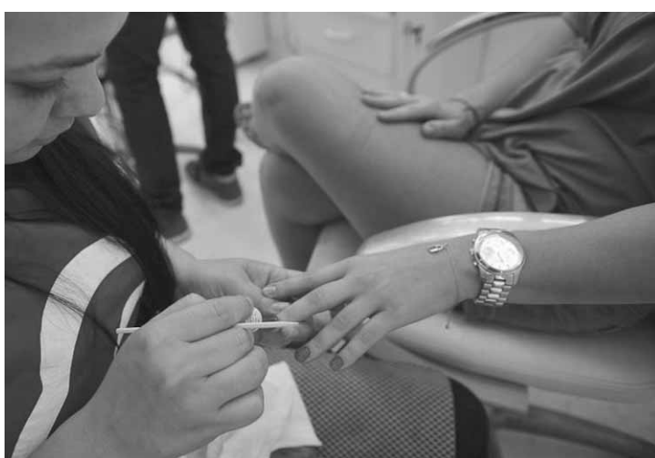
Índice de Confiança de Serviços cresceu 0,9 ponto e atingiu 88,3 pontos, em uma escala de zero a 200.

Com relação ao Índice de Confiança da Indústria a FGV indica um recuo de 2 pontos de setembro para outubro. Essa foi a terceira queda consecutiva do indicador, que acumula perda de 6 pontos no período. O índice caiu para 94,1 pontos, em uma