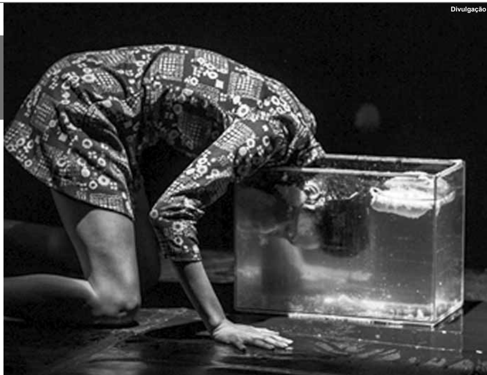
A Cia. Sansacroma.

O espetáculo Rebanho (dias 20, 21 e 22/4) é composto de seis solos que pressupõem uma recusa à submissão, uma insistência em ser, em afirmar a existência. Já o espetáculo, Outras Portas Outras Pontes (dias 4, 5 e 6/5), revela o olhar sobre o apartheid "gentil" existente no Brasil, onde negros operários são tratados como sub-cidadãos e os espaços físicos geram separações. Num segundo, as cenas mostram quando a consciência desta separação