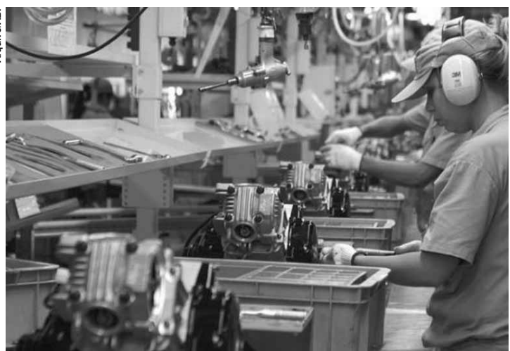
Expansão de 13% na agricultura e estabilidade das indústrias contribuíram para o resultado.

Em 2017, contribuíram para o resultado as altas de 13% na agropecuária e de 0,3% nos serviços, além da estabilidade nas indústrias. O resultado da agropecuária foi o melhor do ano em toda a série, iniciada em 1996. O PIB per capita subiu 0,2% em termos reais,