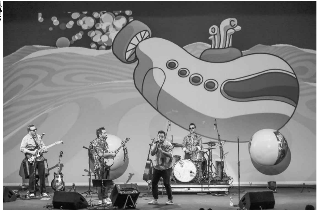
Cena do show "A Bagunça Continua".

Agora, o grupo Beatles Para Crianças faz temporada do show "A Bagunça Continua", com estreia no dia 10, com repertório atualizado, projeções inusitadas e histórias criadas para divertir toda a família! No segundo show do grupo, cinco músicos e arte-educadores que já estão em estúdio gravando seu segundo CD, os recursos estão ainda mais amarrados entre si: músicas, histórias, projeções, brincadeiras e a interação com a plateia estão todos conectados, garantindo uma experiência completa às crianças. As crianças também serão apresentadas a novos e diferentes instrumentos musicais, tais como banjo, tambor de língua, gaita, sanfona, escaleta e outros.