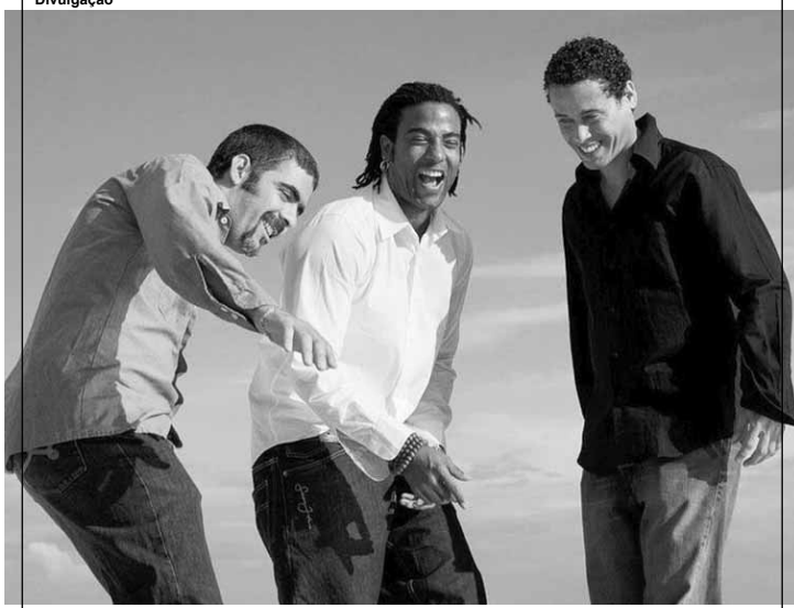
O grupo cubano de hip-hop Orishas.

O grupo cubano de hip-hop Orishas retorna ao Brasil após pouquíssimo tempo, já que havia se apresentado na capital paulista em dezembro de 2017. Na ocasião, o grupo promete encantar aos fãs com a execução de repertório cheio de hits e clássicos para celebrar a música latina e a volta às raízes como headliner da 2ª edição da conceituada festa "Te Quiero". Orishas é uma referência às divindades de religiões africanas chamadas Orixás. A indicação das raízes do trio e a fusão de estilos que os cubanos de Havana criam em sua música se tornou uma referência no começo dos anos 2000.