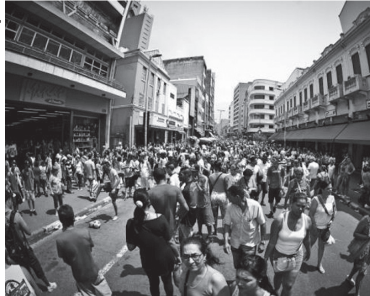
No Brasil, no ano passado, a população residente foi estimada em 205,5 milhões de pessoas. Em 2012, eram 198,7 milhões, uma variação de 3,4%.

No Brasil, no ano passado, a população residente foi estimada