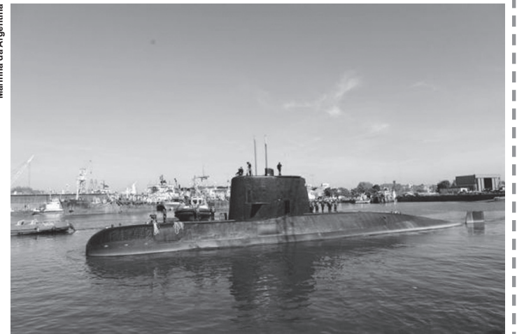
Submarino argentino ARA San Juan, que está desaparecido.

As informações dessas estações foram cruzadas com outras, obtidas pela megaperação de busca e resgate, da qual participam 12 países, além da Argentina. A conclu-