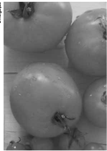
A nova regra será aplicada para todas os produtos compostos por mais de 50% de derivados do tomate.

De acordo com o decreto, os molhos produzidos na Itália devem ser rotulados com o nome do país onde o tomate foi cultivado e processado e eles deverão ser indicados em local de evidência no rótulo para serem facilmente reconhecidos e lidos. A iniciativa conta com o apoio dos ministros italianos das Políticas Agrícolas e do Desenvolvimento Econômico,