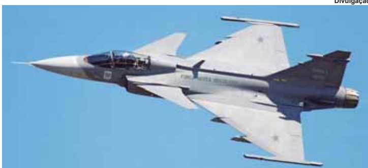
Gripen NG, o mais novo caça da FAB com tecnologia de última geração.

Em cerimônia comemorativa ao Dia do Aviador, realizada na manhã de ontem (23), na Base Aérea de Brasília, o presidente Temer e autoridades militares destacaram o papel da Força Aérea Brasileira (FAB) para o desenvolvimento de tecnologias e para a geração de benefícios sociais. No evento, autoridades e parlamentares foram agradecidos com o Ordem do Mérito Aeronáutico. Temer citou o lançamento do primeiro Satélite Geostacionário de Defesa e Comunicações Estratégicas.