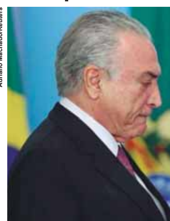
Nas contas da "tropa de choque" de Temer, é possível alcançar de 270 a 280 votos.

As vésperas da votação, os governistas concentram agora os esforços de convencimento em 30 parlamentares "mais problemáticos", que seriam de diversos partidos da base aliada. O grupo é formado por aliados que cobram cargos e a liberação de emendas. Como algumas demandas são ainda da votação da Reforma Trabalhista, o ministro-chefe da Casa Civil, Eliseu Padilha,