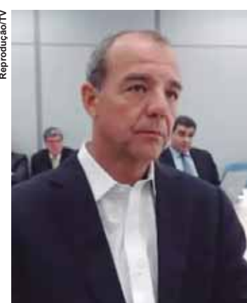
Ex-governador do Rio de Janeiro, Sérgio Cabral.

Cabral está preso desde novembro do ano passado, após as investigações da Operação Calicute, desdobramento da Lava Jato que prendeu o ex-