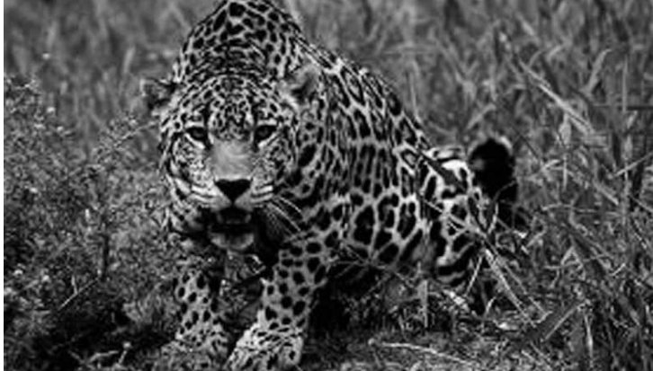
Onça pintada está na lista de animais ameaçados de extinção.

Mais de 300 animais estão em níveis diferentes de ameaça de extinção no estado da Bahia. A Secretaria Estadual do Meio Ambiente (Sema) publicou no Diário Oficial do Estado portaria que cita uma lista de 331 espécies de anfíbios, aves, mamíferos, répteis, invertebrados continentais, peixes, invertebrados marinhos e espécies ameaçadas de “interesse social”. Ao todo, foram avaliadas 2.607 espécies de fauna consideradas raras, endêmicas ou sob ameaça de extinção no território baiano.