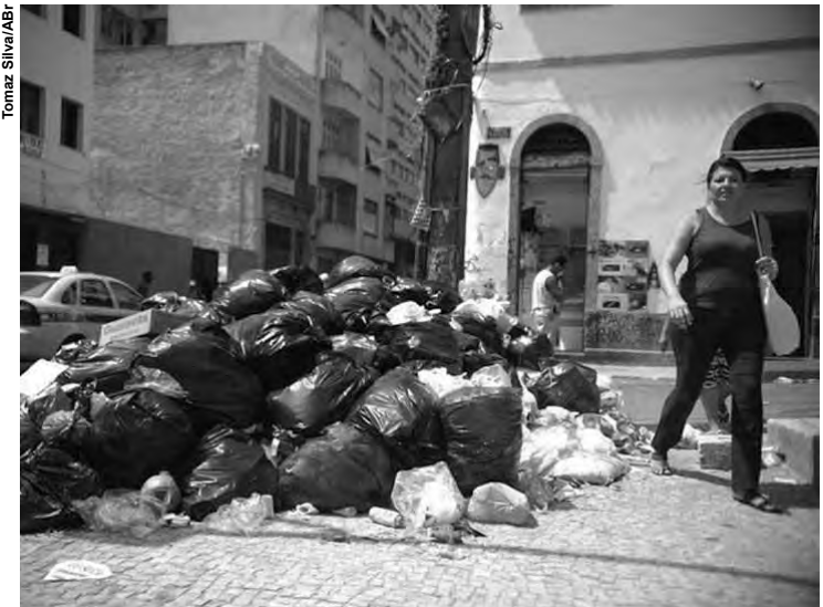
Foram gerados 78,3 milhões de toneladas de resíduos sólidos no ano passado. Na foto, lixo no Rio de Janeiro.

Outro aspecto negativo atribuído à recessão econômica foi o aumento do uso de lixões, com 2.976 ainda presentes em todo o país. Tiveram destinação inadequada, em 2016, 81 mil toneladas de lixo. O uso de lixões a céu aberto cresceu de 17,2% em 2015 para 17,4% no ano passado. Os aterros controlados, que ainda existem no país, são semelhantes a lixões, por vezes cercados, com cobertura de