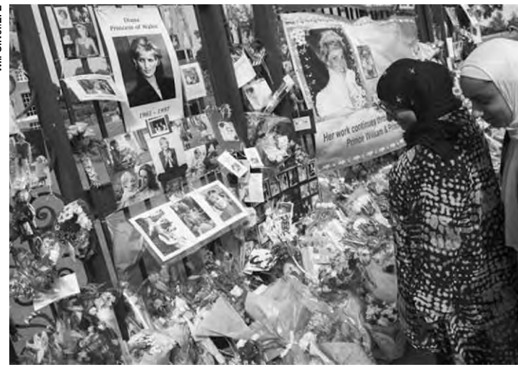
Muita gente compareceu ontem ao Palácio de Kensington para homenagear Diana, a Princesa de Gales.

Há 20 anos o Reino Unido amanheceu com a notícia da morte de Diana - divorciada do príncipe Charles e herdeiro da