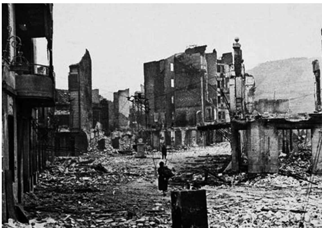
Guernica, cidade basca impiedosamente bombardeada e metralhada em abril de 1937.

O objetivo da ação, de acordo com a advogada da Prefeitura