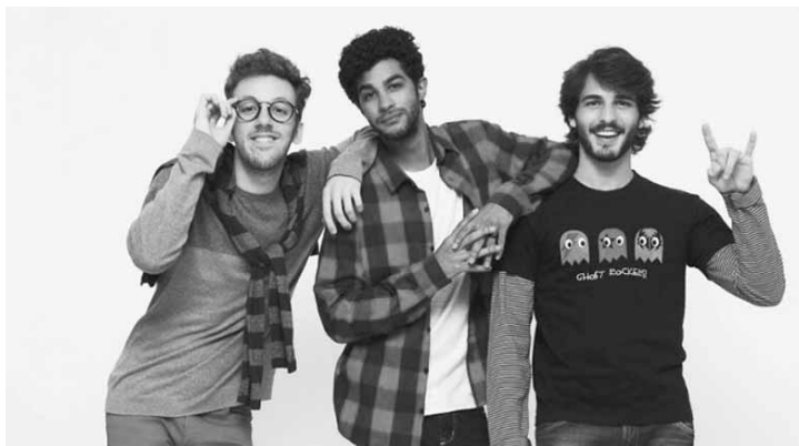
Elenco da peça "Querida Quitinete".

"Querida Quitinete" conta a estória de três amigos com personalidades bem diferentes, mas algo em comum: viver da arte. Juntos em busca desse sonho, Pereco, Jorge Wilson e Daito resolvem dividir uma quitinete, porém os problemas do dia a dia começam a surgir: a falta de dinheiro, alugueis atrasados, inconvenientes da