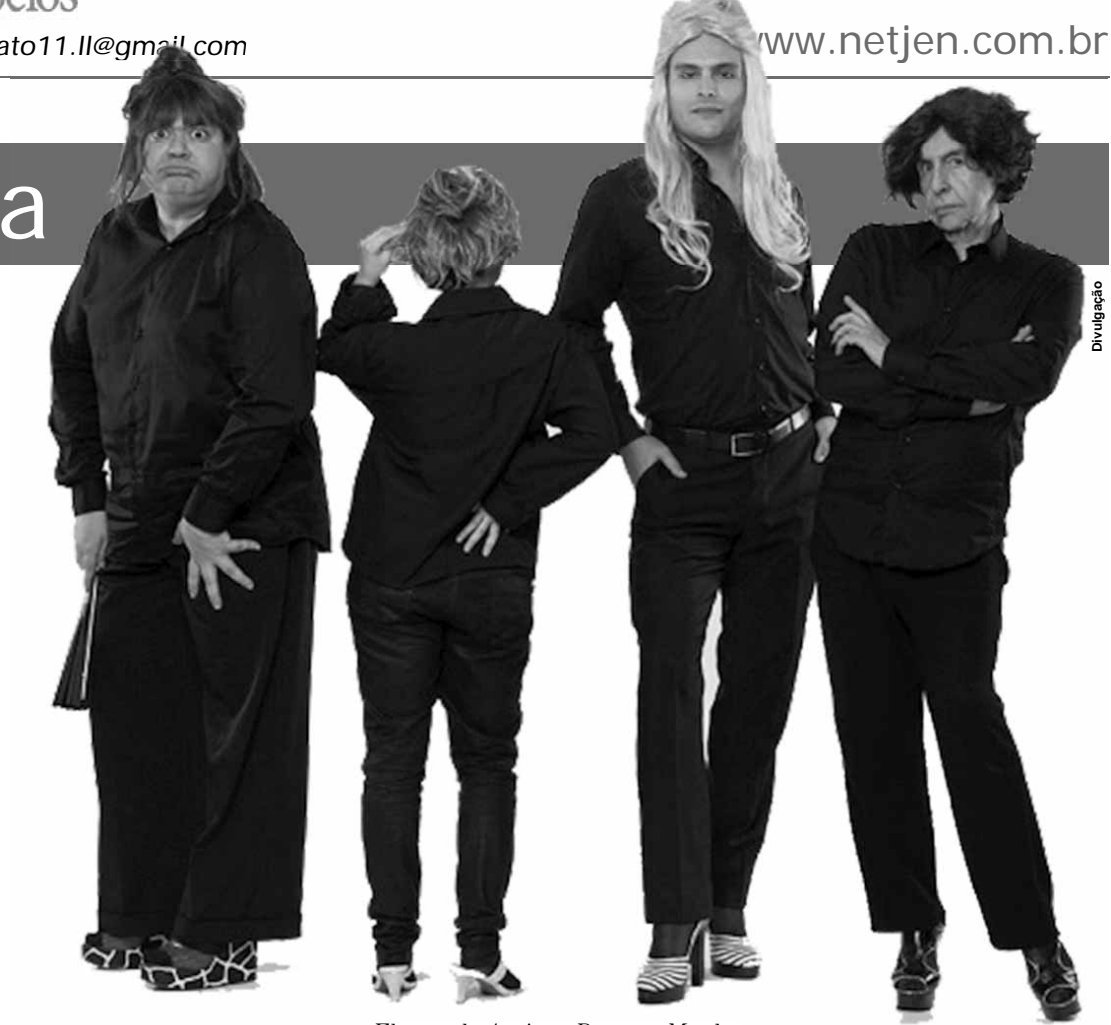
Elenco de Amigas Pero no Mucho.

Essa epopeia se dá através do encontro de quatro amigas em uma tarde de sábado, onde todas, ou quase todas, as roupas sujas são lavadas por elas. Com humor cáustico, ironia e irreverência, elas falam sobre suas dissimulações, devaneios e loucuras. Quatro mulheres bem-sucedidas - ou não - comuns e sofisticadas que numa única tarde fazem revelações que as surpreendem e surpreendem o público que tem