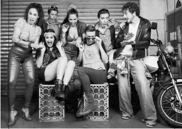
Elenco do musical "Na Laje".

A peça "Na Laje" conta a estória de um grupo de pessoas que vive na Cohab. Pimpolho é um cara bem legal que quer levar sua vida simples, administrando seu boteco, tocando seu pagode com os amigos e casando com sua namorada, Tânia. Contudo, o concurso de televisão nacionalmente conhecido como "A Garota da Laje" vai fazer uma seleção no bairro, algo que mudará a vida dos dois e da produtora do concurso Inara.