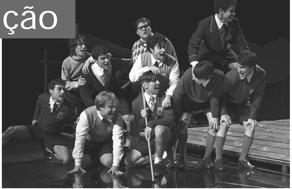
Cena de "Senhor das Moscas".

Os meninos se vêm sob duas lideranças naturais: Jack está sempre preocupado em caçar, matar os porcos selvagens que existem na ilha, organizando sua equipe de caçadores; enquanto Ralph ocupa-se em deixar uma fogueira sempre acesa, para que possam ser, um dia,