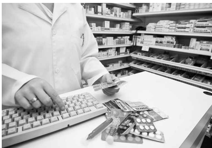
O reajuste anual no preço dos remédios em maio foi o principal responsável pela alta no índice.

A ligeira alta de maio em relação a abril foi pressionada pelos preços dos remédios, que subiram 2,08% e causaram impacto de 0,07 ponto percentual nos 0,24% do IPCA-15 relativo ao mês. Segundo o IBGE, a pressão no preço dos remédios foi consequência do reajuste anual que passou a valer a partir de 31 de março, variando entre