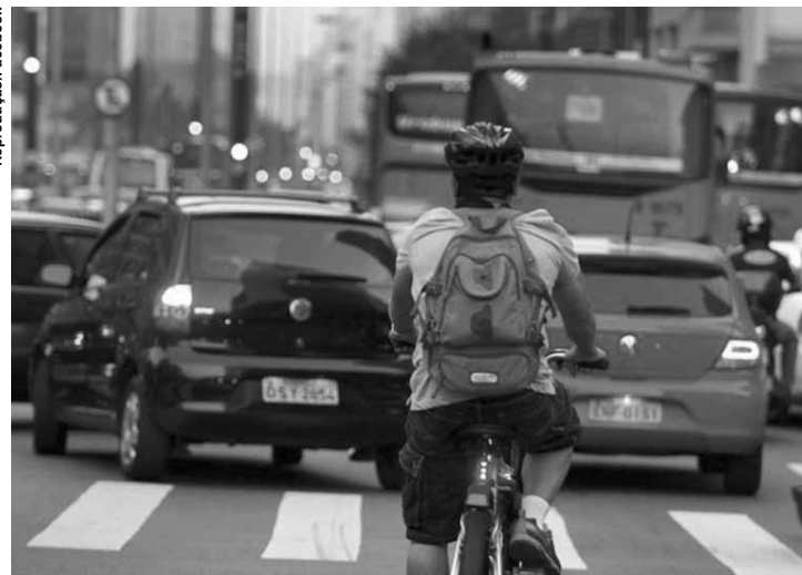
Ciclista em meio ao trânsito de São Paulo.

menores mortos nas estradas são usuários vulneráveis: pedestres, ciclistas ou motociclistas. Quase 88.590 em relação às vítimas do sexo feminino da mesma idade (26.712) morreram por ferimentos ocasionados por conta de acidentes na via pública. Já muitas das