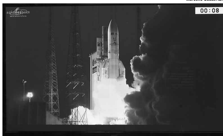
O equipamento já está na órbita geostacionária.

Os testes para a verificação do funcionamento do satélite brasileiro para comunicação e defesa começaram no último sábado (13), quando o equipamento chegou à órbita geostacionária. O processo de verificação dos sistemas do satélite devem levar cerca de 45 dias. De acordo com a Telebras, serão feitas verificações do funcionamento de todos os sistemas, medidas de carga útil e a constatação de que o satélite está totalmente apto para entrar em operação comercial.