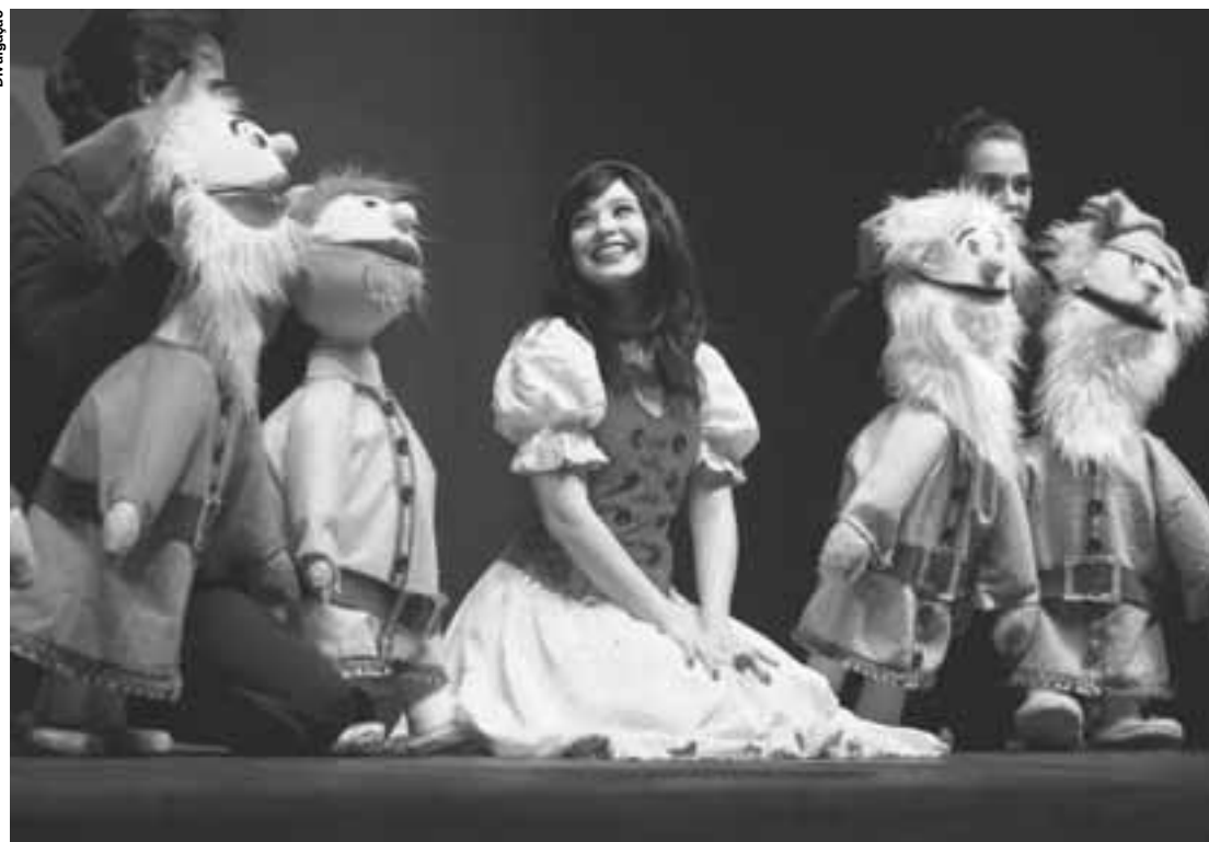
Cena do musical infantil "Branca de Neve ao Som dos Beatles".

A montagem é uma irreverente e divertida versão do clássico Branca de Neve, um dos mais famosos contos de fadas dos irmãos Grimm. A adaptação se vale de trechos da obra de William Shakespeare para ilustrar o romance de Branca de Neve e Encantado, ao som de músicas dos Beatles. Com 6 atores no elenco, a montagem dialoga com a atualidade trazendo características contemporâneas e expressionistas. A peça é narrada por uma simpática vovó, a própria Branca de Neve, revivendo seu passado. A rainha conhecida tradicionalmente como perversa e má, revela-se uma figura atrapalhada e engraçada, e o espelho ganha ares divertidos, capazes de proporcionar boas gargalhadas. A trilha