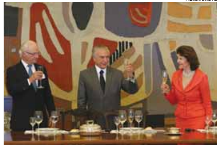
Presidente Michel Temer durante almoço em homenagem aos reis da Suécia, Carlos Gustavo e Sílvia, no Palácio Itamaraty.

Brasília - O presidente Michel Temervoltou a destacar a importância da reforma da Previdência, durante brinde em almoço oferecido ao Rei Carlos XVI Gustavo e da Rainha Sílvia da Suécia no Palácio Itamaraty.