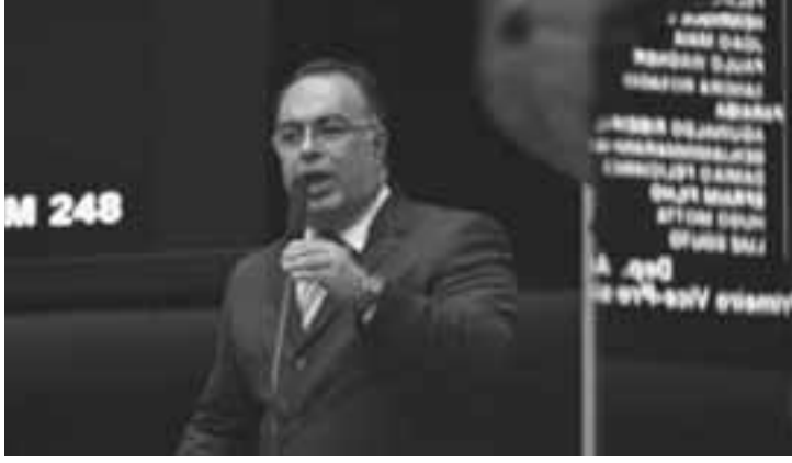
André Vargas foi cassado em 2014 pela Câmara dos Deputados.

O ex-deputado federal André Vargas foi condenado a quatro anos e meio de prisão em regime fechado por lavagem de dinheiro. A sentença foi publicada ontem (6) pelo juiz Sérgio Moro, responsável pelos processos em primeira instância da Operação Lava Jato. É a segunda condenação de Vargas dentro da operação. Também foi estipulada uma multa equivalente a R$ 492,5 mil a ser paga por Vargas. O ex-deputado também está impedido de assumir cargo ou função pública pelo dobro do tempo da pena, ou seja, nove anos.