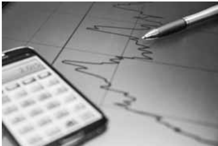
A taxa de março foi calculada com base nos preços coletados entre 1º e 31 do mês de referência.

Eles indicam que a alta acumulada pelo indicador nos três primeiros meses do ano foi de 0,12%. Em 12 meses, o IGP-DI acumula alta de 4,41%. A taxa de março foi calculada com base nos preços coletados entre 1º e 31 do mês de referência. O comportamento dos preços ao produtor foi decisivo para a taxa negativa, uma vez que os preços ao consumidor e da construção fecharam com resultado positivo. No primeiro caso, houve aceleração de preços frente ao mês imediatamente anterior e no segundo, desaceleração, embora a taxa ainda tenha fechado