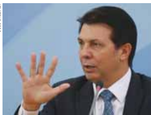
Deputado Arthur Maia fala sobre mudanças na reforma da Previdência.

O ministro da Secretaria do Governo, Antônio Imbassahy, disse ver com naturalidade o fato de a proposta sofrer alterações durante o trâmite no Congresso, uma vez que trata-se de um dos "mais complexos projetos" dos últimos anos. "O Executivo enviou proposta. Com isso passa a ser o Congresso o protagonista dos debates e das deliberações. Seria até surpreendente que uma matéria dessa natureza e complexidade tramitasse na Câmara sem nenhum tipo de alteração", disse.