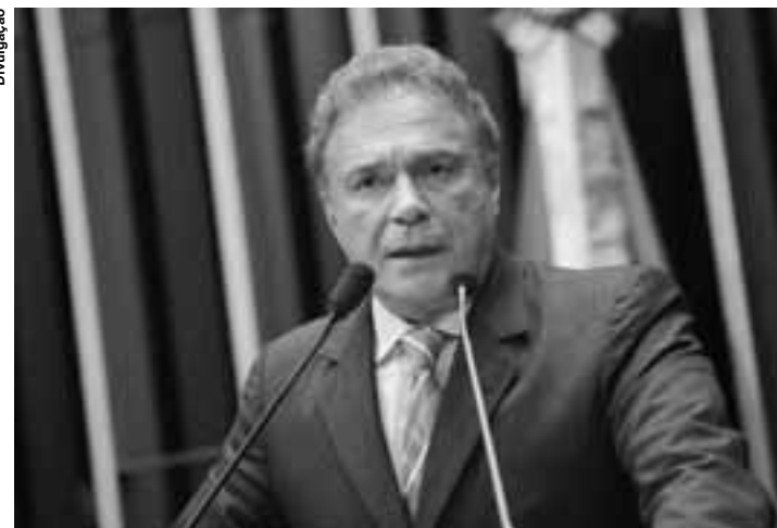
Senador Alvaro Dias (PV-PR).

Para o senador o Brasil precisa superar este "impasse" e especialmente evitar que se torne "jurisprudência" o fatiamento de processos de impeachment. O mandado de segurança é relatado no STF pela ministra Rosa Weber, que foi quem solicitou o parecer da PGR. Alvaro disse também de que o ministro da Educação, Mendonça Filho, estaria deixando de cumprir a Lei de Acesso à Informação (LAI) ao não responder a um requerimento de informações enviado