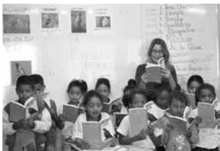
Até o 2º ano do ensino fundamental, geralmente aos 7 anos, os estudantes deverão ser capazes de ler e escrever.

Na educação infantil, que vai até os 5 anos, a BNCC estabelece que seja desenvolvida a "oralidade e a escrita". O conteúdo começa a ser introduzido aos poucos. Até 1 ano e 6 meses, as creches deverão garantir, por exemplo, que as crianças reconheçam quando são chamadas pelo nome ou demonstrem interesse ao ouvir a leitura de poemas e a apresentação de músicas.