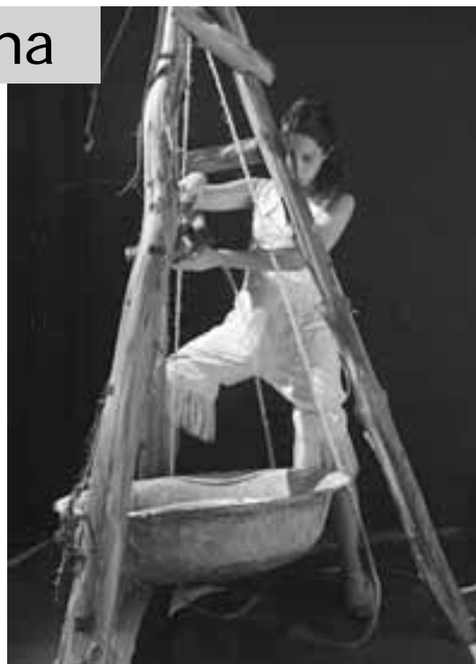
Cena do espetáculo "Quarança".

Serviço: Espaço Cultural a Próxima Companhia, R. Barão de Campinas, 529, Campos Elíseos. Sextas e sábados às 21h e domingos às 19h. Ingressos: R$ 20 e R$ 10 (meia). Até 21/05.