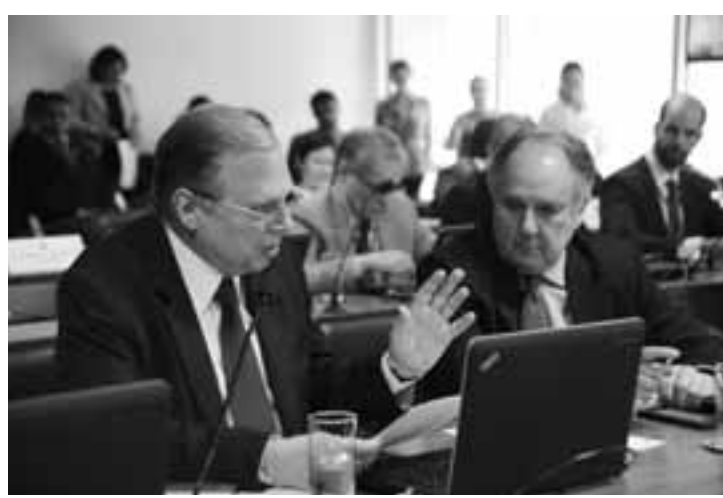
Senador Tasso Jereissati (PSDB-CE), à esquerda, relatou o substitutivo da Câmara na reunião da CRE de ontem (6).

A proposta concede ainda anistia na forma de residência permanente aos imigrantes que, se ingressados no Brasil até 6 de julho de 2016, façam o pedido até um ano após o início de vigência da lei, independentemente da situação migratória anterior. A moradia no Brasil é autorizada para os casos previstos de visto temporário e também para o aprovado em concurso; para beneficiário de refúgio, de asilo ou de proteção ao apátrida; para quem tiver sido vítima de tráfico de pessoas, de trabalho escravo ou de violação de direito agravada