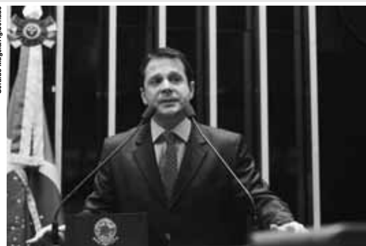
Senador Reguffe (sem partido-DF).

Reguffe disse que, diante da concorrência, cabe aos taxistas melhorar a qualidade do serviço e reduzir os preços. Entretanto, o senador defendeu a cobrança de tributos do Uber. O senador declarou-se contrário também ao projeto sobre abuso de autoridade e às emendas à proposta que acaba com o foro privilegiado.