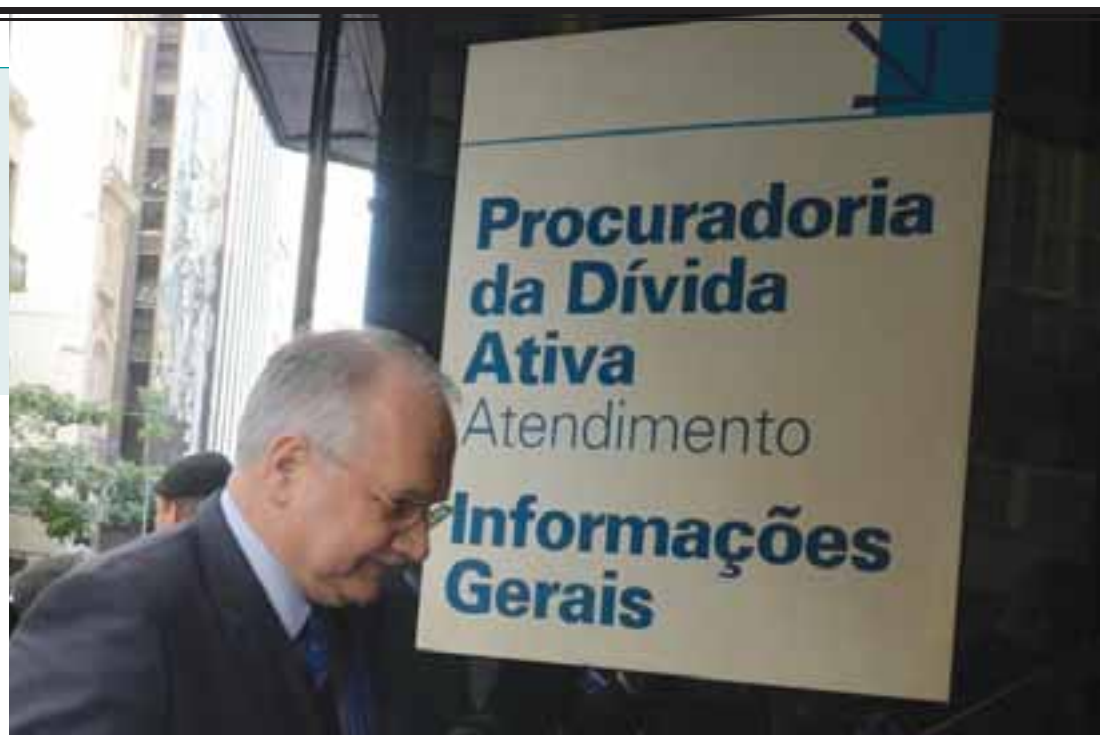
Decisão do ministro Fachin abre a possibilidade de a PGR investigar 3 senadores e 4 deputados, no âmbito de um procedimento de investigação já em andamento.

Teriam sido repassados R$ 850 mil a Valdir Raupp, R$ 450 mil a Garibaldi Alves Filho, R$ 300 mil a Agripino Maia, R$ 250 mil a Walter Alves, R$ 250 mil a Felipe Maia, R$ 100 mil a Jandira Feghali, e R$ 400 mil a Luiz Sérgio, por diferentes construtoras, sobretudo Queiroz Galvão e Camargo Correia. Como um todo, o período corresponde às eleições de 2010 até as eleições de 2014 - embora cada caso tenha um