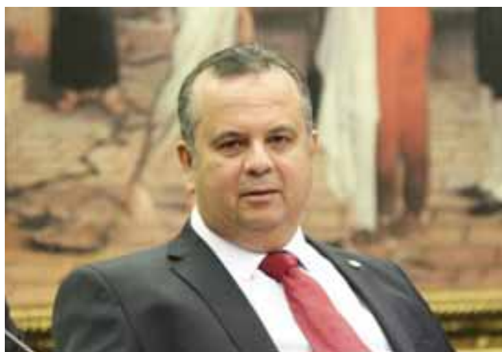
O relator, deputado Rogério Marinho (PSDB/RN).

"Existe uma série de emendas que tratam de novas formas de trabalho que não estão contempladas na legislação atual. No nosso substitutivo, vamos ampliar o escopo, justamente por esse processo de demanda reprimida, vamos buscar o consenso possível", ressaltou. Para ele, a proposta enviada pelo governo visa a modernizar a legislação e desburocratizar o setor, ao preservar empregos e abrir novas oportunidades de trabalho. "A regra deve ficar clara e transparente para dar segurança jurídica", afirmou.