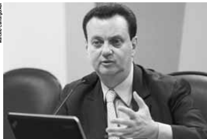
Ministro da Ciência e Tecnologia, Gilberto Kassab.

Ele reiterou que o governo espera que haja uma solução de mercado para a empresa, em recuperação judicial. Mas o governo deve divulgar nos próximos dias uma medida provisória com regras para fazer a intervenção. "Quando surgiu essa hipótese de intervenção em uma concessão, o governo despertou para ter uma legis-