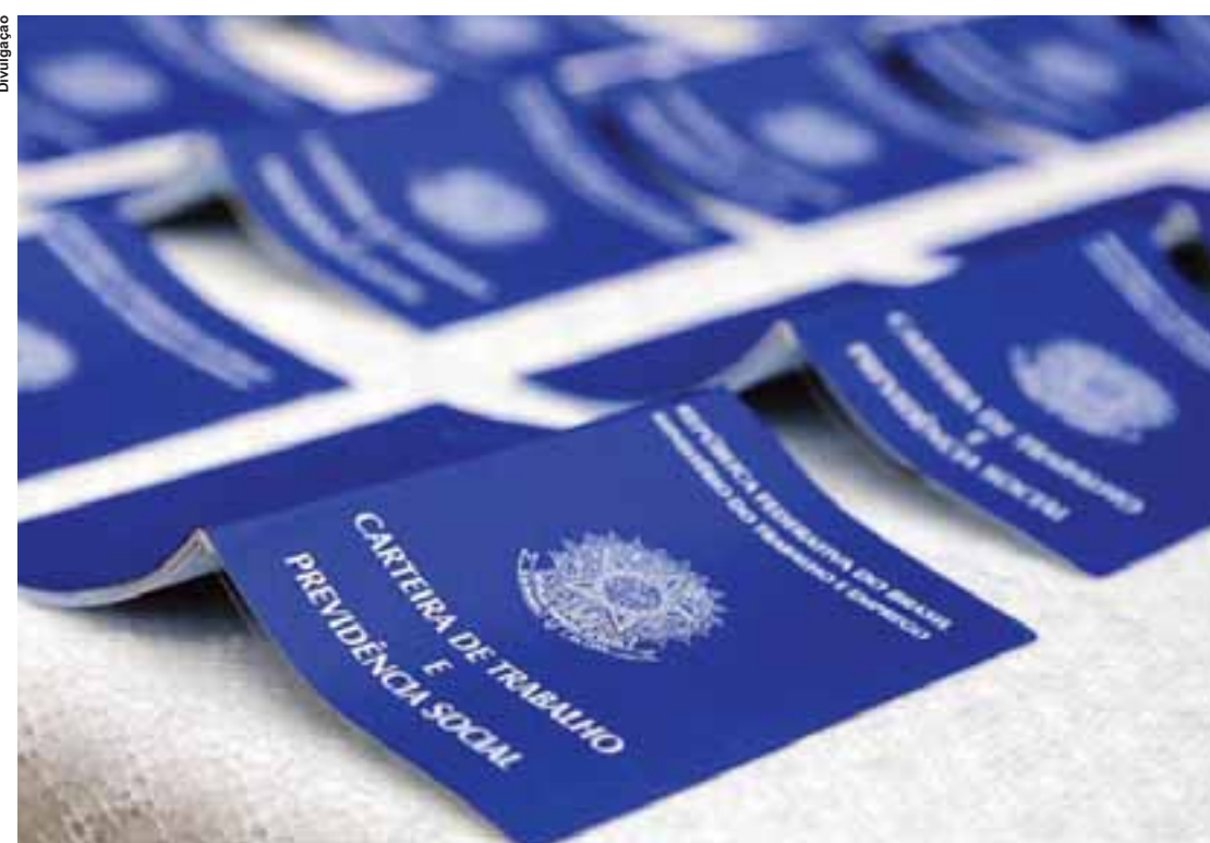
O projeto altera as regras da CLT e outros dispositivos.