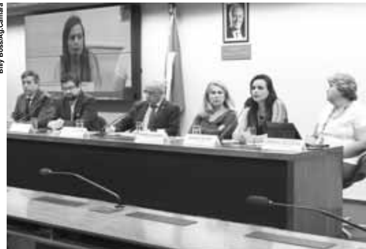
Especialistas ouvidos na Câmara ressaltaram a importância da prevenção.

A pesquisadora ressaltou a importância de capacitar os agentes comunitários de saúde, que atuam no interior do País, para detectar sinais da presença deste tipo de doença. "É muito importante que o País entenda a necessidade de aperfeiçoar as informações, principalmente as que estão no campo. E isso só vai ser feito se as pessoas que estiverem no campo forem capacitadas e puderem fazer a vigilância