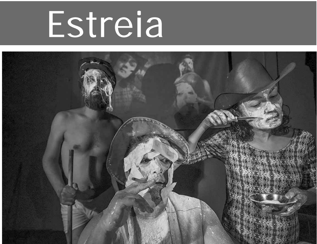
Espectáculo "Branco, O Cheiro do Lírio e do Formol".

O espetáculo aborda tema polêmico, onde a tentativa de criticar o racismo naturalizado do branco a partir do seu próprio ponto de vista autodestrutivo e autocrítico dá ensejo à criação de uma narrativa fragmentária, estruturada em camadas complementares e contraditórias. Uma família de classe média, formada por um menino, seu pai e sua tia, vive um cotidiano comum, até que alguns acontecimentos externos forçam essas pessoas a terem que lidar com o que existe do lado de fora da casa. Essa trama lacunar e incompleta é contada de forma fragmentária alternando com uma outra camada narrativa que conta o próprio processo de criação da peça, trazendo