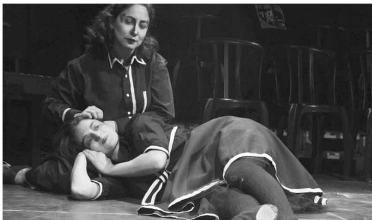
Cena de "Pater".