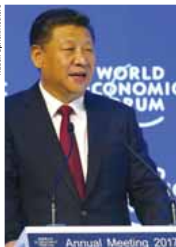
Presidente chinês, Xi Jinping.

Citando indiretamente os planos de Trump de criticar acordos internacionais e de querer taxar produtos do exterior, Xi Jinping destacou que “gostem ou não, a economia global é um enorme oceano do qual ninguém pode sair completamente”. Para o presidente de um país que há apenas 38 anos abriu seu mercado para o mundo, o chinês ressaltou que o panorama comercial e industrial mudou completamente durante esse período e concordou que as “regras do