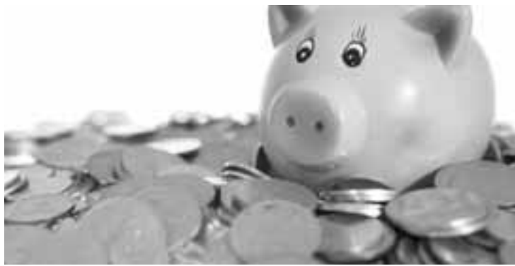
Quando se fala em aplicação financeira, a caderneta de poupança sempre liderou a preferência do brasileiro.

Este ano, 76% dos brasileiros com algum dinheiro guardado afirmaram que a poupança é a principal opção de investimento, uma queda de 12 pontos percentuais em relação ao ano de 2012. Não à toa, a poupança era mais vantajosa na ocasião, já que nos anos de 2012 e 2013 as taxas de juros brasileiras esta-