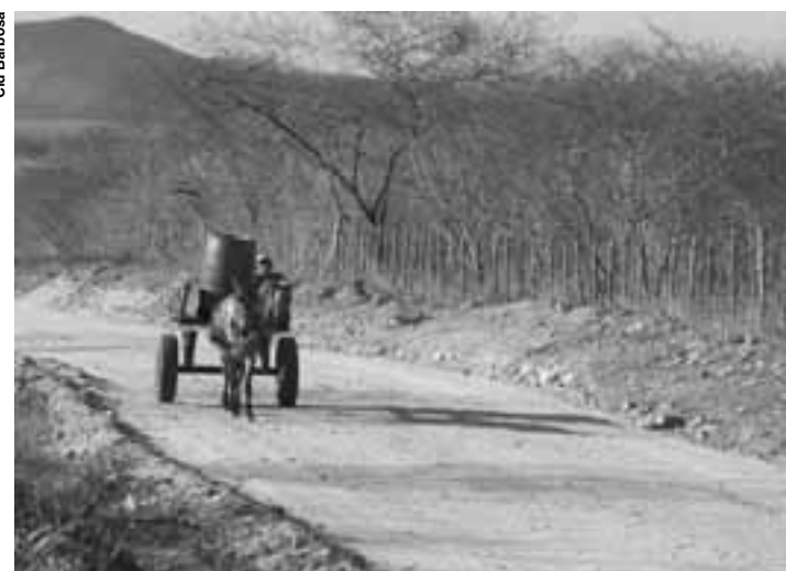
Seca no Nordeste começou em 2012: estiagem é considerada uma das piores dos últimos cem anos.

Para o deputado Zeca Cavalcanti (PTB-PE), é preciso desenvolver políticas de convívio com a seca. O deputado é autor de projeto que prevê ações por parte do poder público para garantir o desenvolvimento econômico das regiões onde ocorrem as secas. "O objetivo é que sejam elaboradas políticas públicas com determinados órgãos públicos como Codevasf, Dnocs e Sudene, além de universidades, e promover a discussão de políticas públicas de convivência permanente com a seca", afirma. Ele destaca que o fenômeno climático "vem,