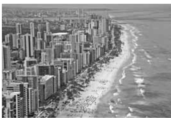
Vista aérea da Praia de Boa Viagem, em Recife.

"A existência de critérios e valores atualizados na PGV do município é fundamental para a adequada arrecadação do IPTU. Caso o valor venal