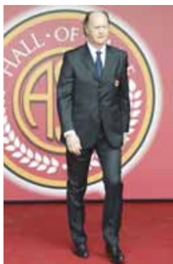
Roma homenageia Falcão no Hall da Fama.

Além de Falcão, outras personalidades do futebol italiano fo-