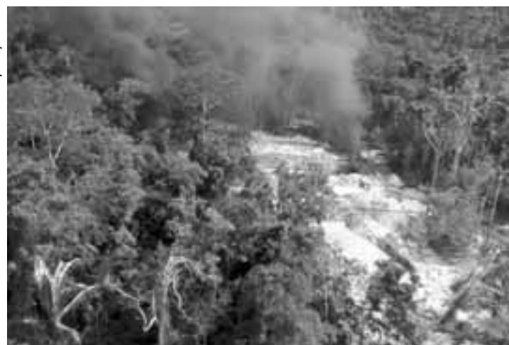
Extração de madeira e incêndios são principais fatores para queda da extensão da área intacta de florestas.

Mais da metade da redução desta paisagem intacta está concentrada em apenas três países: Rússia, Brasil e Canadá, que tiveram perdas de 179 mil