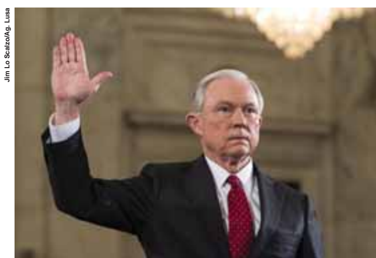
O senador republicano Jeff Sessions, conhecido por seu discurso anti-imigração, foi nomeado por Trump para ser o novo secretário de Justiça.