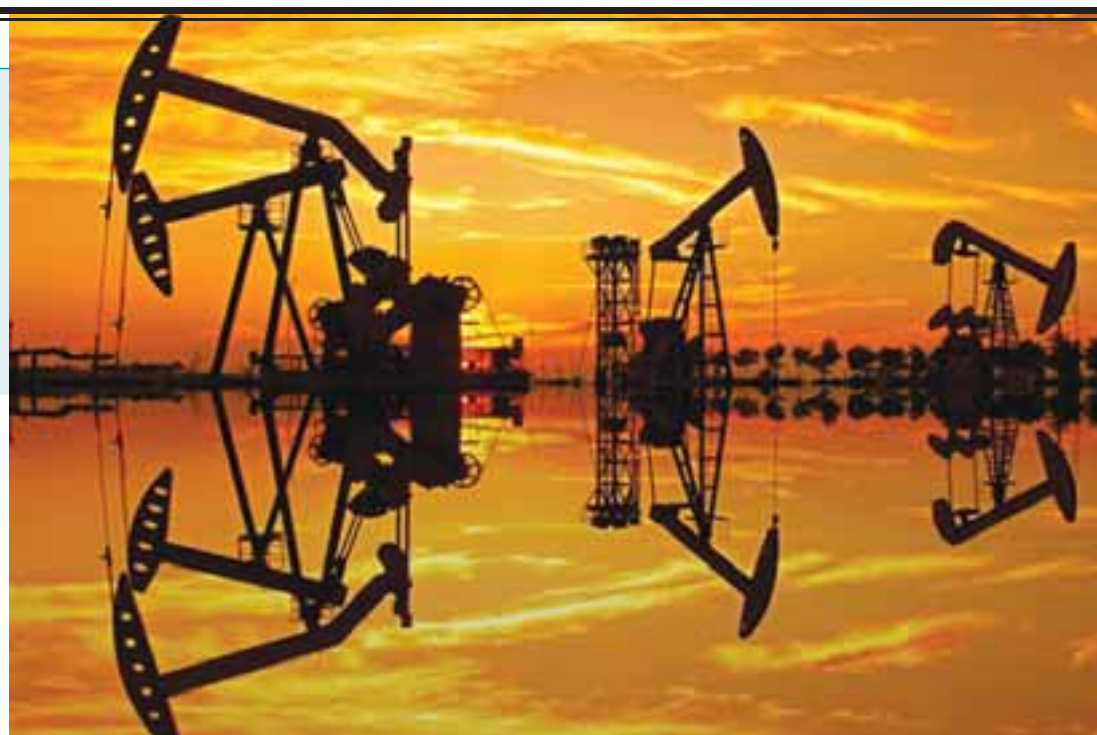
Depois de uma contração de 3,9% em 2015 e 3,2% em 2016 no Brasil, a projeção aponta para dois anos de expansão.

“O Brasil viveu sua recessão mais profunda já registrada nos últimos dois anos. A queda acumulada da economia do País desde o final de 2014 supera 8%, diante de desequilíbrios macroeconômicos severos e uma crise política que levou a uma contração profunda da demanda doméstica”, indicou. Se o fundo do poço foi superado, a ONU alerta que o Brasil também foi um dos países