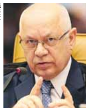
Ministro Teori Zavascki.

Como relator da Lava Jato na Corte, cabe a Teori validar as delações. Nos depoimentos, os delatores relatam propina a políticos e operadores no Brasil e fora do País em troca da conquista de obras públicas, bem