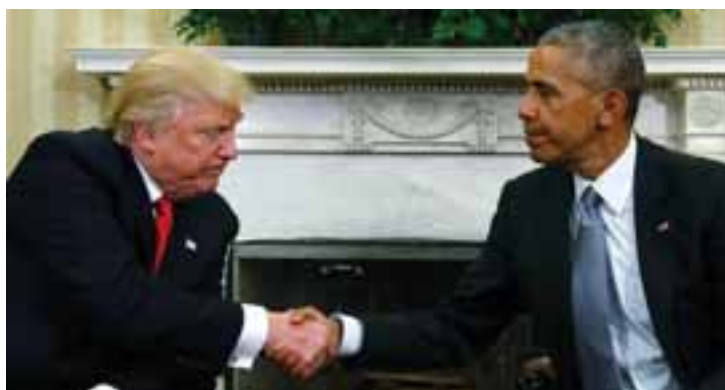
O presidente Barack Obama cumprimenta o presidente eleito, Donald Trump, no Salão Oval da Casa Branca, em Washington.

"As mesmas pessoas que fizeram as pesquisas eleitorais falsas, e estavam erradas, agora fazem rankings de aprovação. São manipulados, como antes", escreveu o magnata. A resposta de Trump foi uma alfinetada ao jornal "The Washington Post", que publicou antes das eleições que a candidata Hillary Clinton seria a mais votada. O jornal acertou, mas Trump venceu no colégio eleitoral. O republicano toma posse na próxima sexta-feira (20) como novo presidente dos Estados Unidos (ANSA).