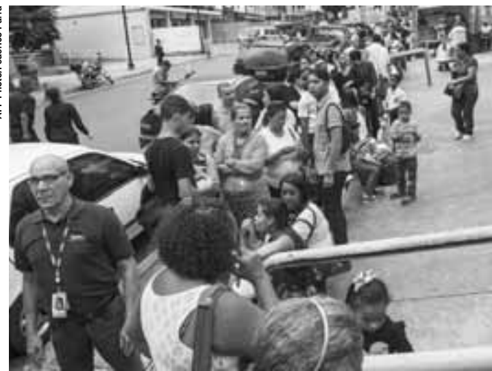
Venezuelanos fazem fila em um supermercado de Caracas.