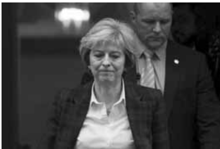
Theresa May anuncia como será saída do Reino Unido da União Europeia.

O discurso de May, bastante otimista, foi intitulado A Global Britain (Uma Grã-Bretanha Global, em tradução livre), e transmitiu a ideia de que a saída da UE é uma oportunidade para o Reino Unido se tornar ainda mais internacional. “Deixaremos