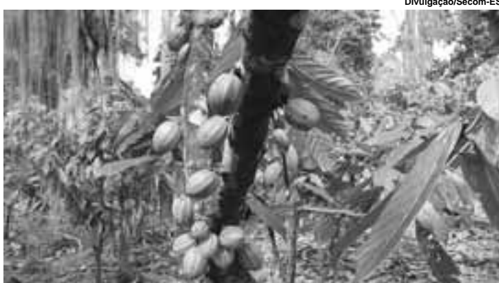
O objetivo é aumentar a qualidade do cacau brasileiro por meio de estímulo à produção.

Começou a tramitar no Senado projeto da Câmara que institui a Política Nacional de Incentivo à Produção de Cacau de Qualidade. A intenção do projeto é aumentar a qualidade do cacau brasileiro por meio de estímulo à produção, industrialização e comercialização do produto em categoria superior. Caberá ao poder público determinar parâmetros para a certificação do cacau de categoria superior.