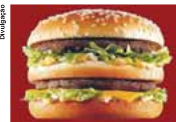
O índice Big Mac indica que a taxa de câmbio deveria ser de R$ 3,26.

Para tentar colocar outros aspectos na conta, a Economist também calcula um índice Big