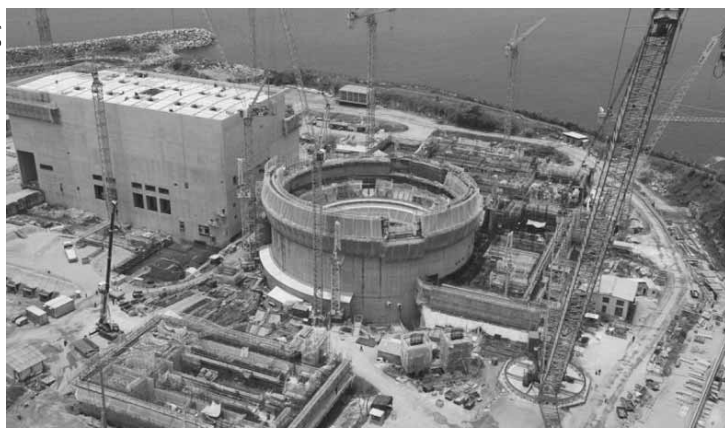
As empresas estão dispostas a conversar no sentido de explorar a possibilidade de parceria para a conclusão de Angra 3.