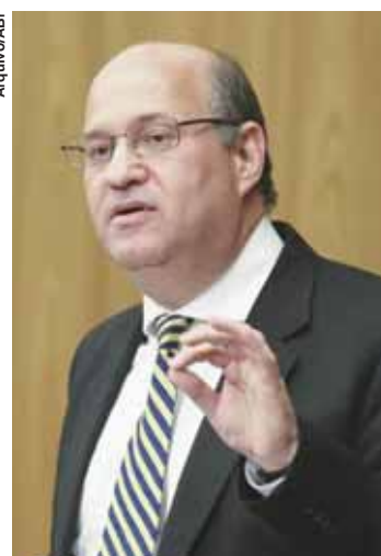
Presidente do BC, Ilan Goldfajn.

Questionado sobre pressões para baixar os juros, Goldfajn disse que isso é recorrente no Brasil. Ele avaliou que o BC está fazendo o que é necessário, tem credibilidade e agora é “parte da solução”. O BC achava que a partir de setembro haveria uma reversão mais forte da recessão econômica, não aconteceu. “Não significa