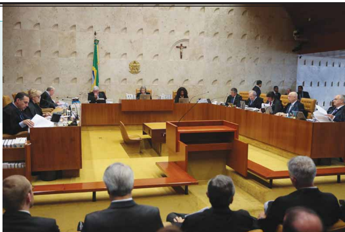
Na sessão plenária do STF, o ministro Celso de Mello afirmou que o afastamento poderia trazer consequências negativas para o funcionamento do Senado.

Celso de Mello foi além, tocando na crise política vivida no País, e afirmou que o afastamento poderia trazer consequências negativas para o funcionamento do Senado. Os ministros Celso de Mello, Teori Zavascki, Dias Toffoli, Luiz Fux e Ricardo Lewandowski votaram no sentido de acolher apenas parcialmente a liminar concedida pelo mi-