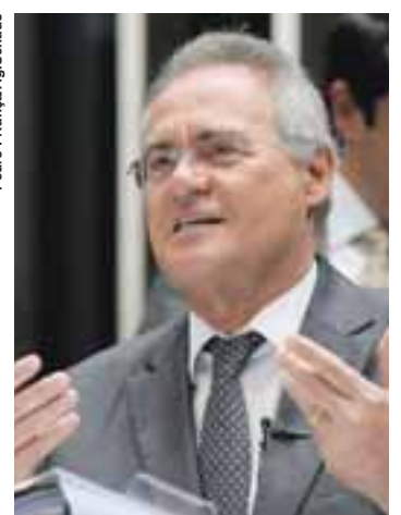
Presidente do Senado, Renan Calheiros.

• que veda a reeleição para os cargos de presidente da