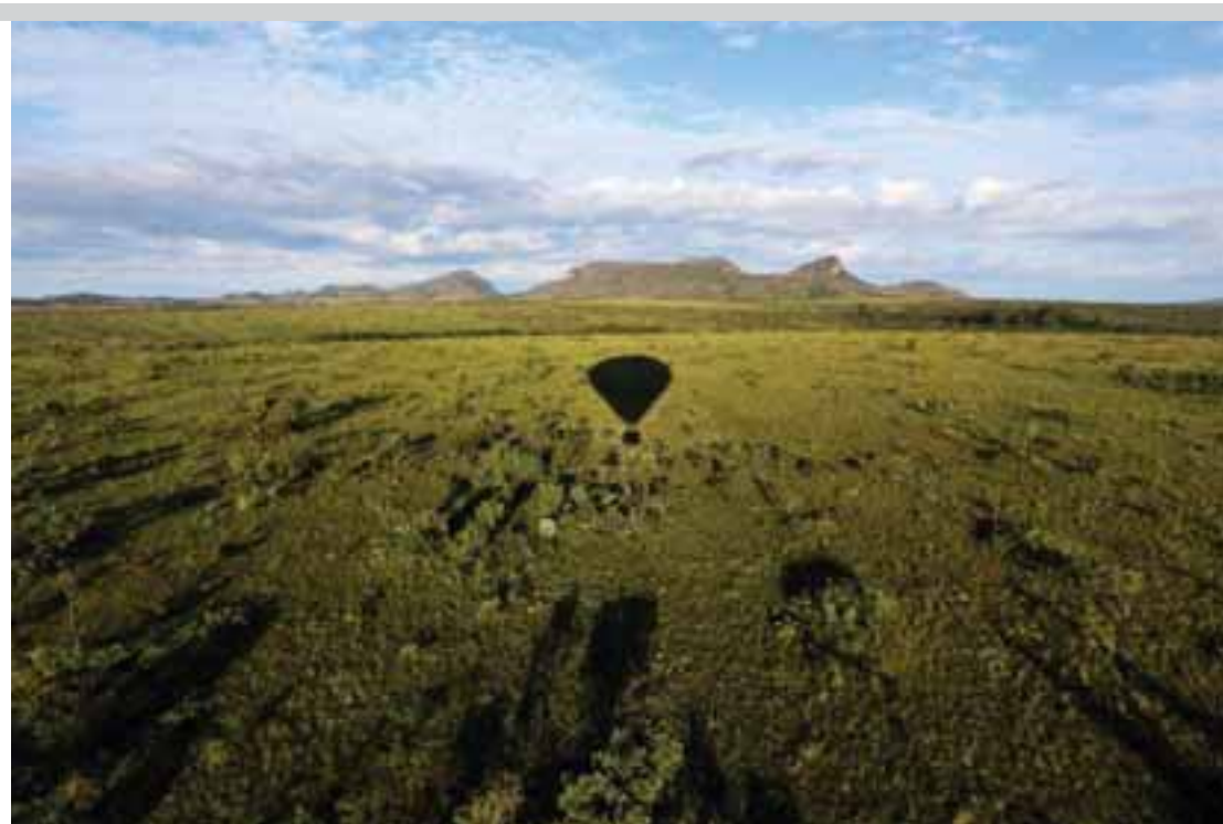
Parque Nacional da Chapada dos Veadeiros, no município de Alto Paraíso.