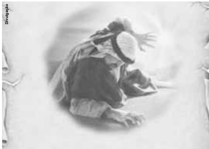
"Paulo de Tarso"

No espetáculo "Paulo de Tarso", o personagem Saulo tem sua vida centrada nas ideias de Rubens, sacerdote saduceu, que deixa claro sua oposição ao cristianismo. Saulo tem um carinho grande por Diná, prometida de Rubens e simpatizante do cristianismo. Antes de seu encontro definitivo com Jesus, Saulo irá encontrar vários personagens convertidos à nova religião: Pedro, João, Hagar, Barnabé, etc. Em sua perseguição aos cristãos, ele terá uma experiência real com Jesus, ficando completamente cego. Sua visão retorna quando ele