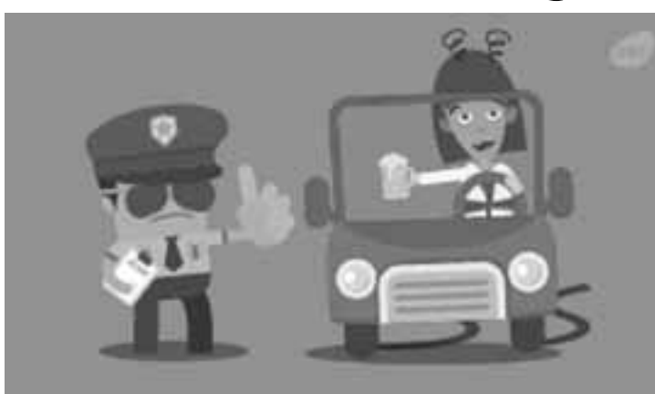
Banner de divulgação da Operação Lei Seca.