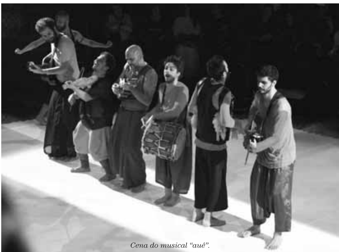
Cena do musical "auê".

Serviço: Teatro FAAP, R. Alagoas, 909, Higienópolis, tel. 3662-7232. Sexta (16) e sábado (17) 21h e domingo (18) às 18h. Ingresso: R$ 70.