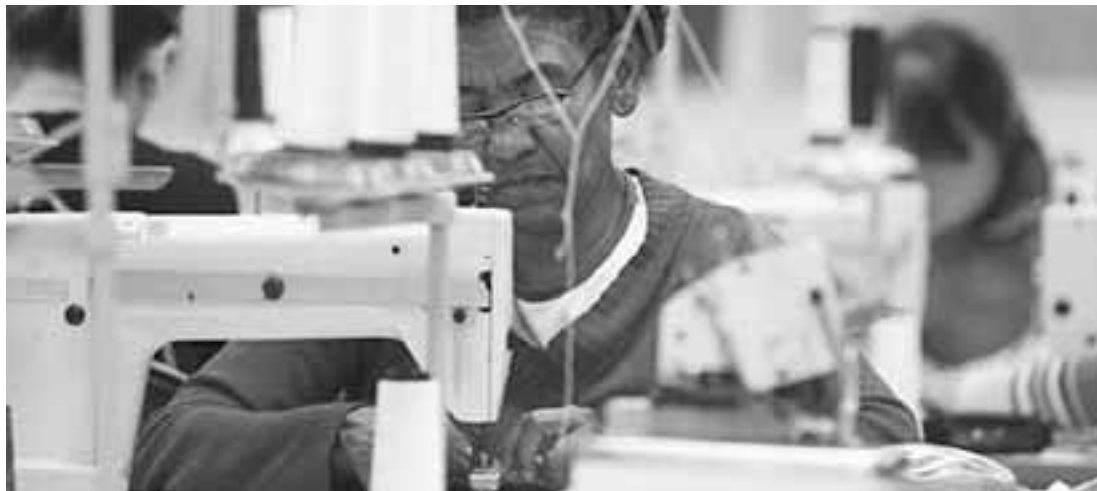
Pessoas que perderam seus empregos abrem novas empresas visando a geração de alguma renda.

O número de novos Microempreendedores Individuais (MEIs) nascidos nos nove primeiros meses deste ano foi de 1.220.529 contra 1.159.388 no mesmo período de 2015, alta de