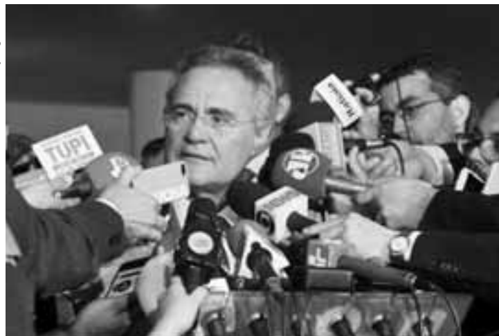
Presidente do Senado, Renan Calheiros.

coercitivas, as buscas e apreensões, o pedido de prisão, a prisão da polícia, a usurpação de competência, tudo é decorrente do fato do procurador-geral da República ter colocado como membros da força tarefa