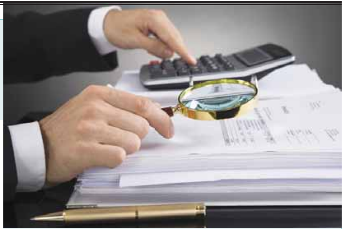
A Receita poderia analisar uma forma diferente de parcelamento que esteja mais adequada ao faturamento da empresa.

Para ele, o que explica o elevado índice, excluindo da análise as companhias que têm conduta fraudulenta, é ausência de caixa das companhias, uma vez que fica responsável por recolher seu tributo e de seus clientes, além de ter de