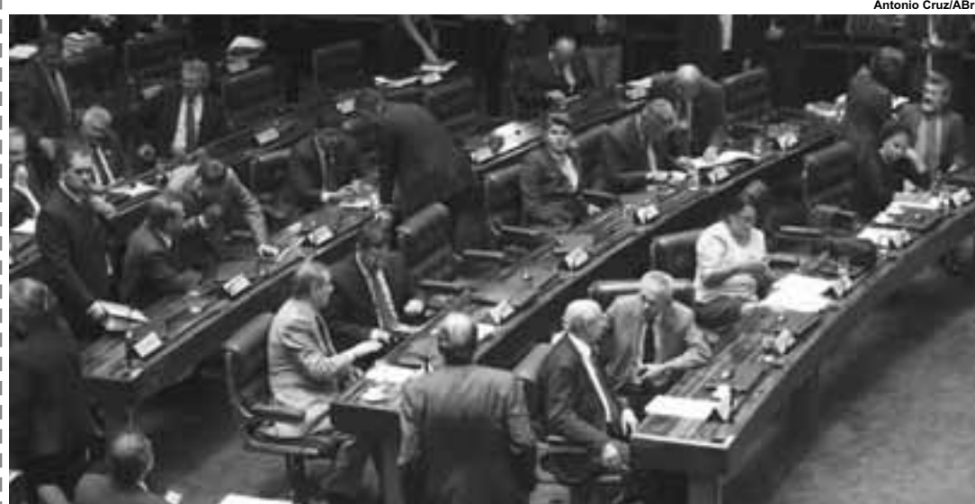
Senadores aprovaram, em segundo turno, o texto-base da proposta do Teto de Gastos.

O plenário do Senado aprovou o texto final da proposta que institui o teto de gastos públicos para os próximos 20 anos. O texto base da PEC já tinha sido aprovado mais cedo, mas dois trechos da proposta tinham sido destacados para serem votados separadamente, numa tentativa da oposição de modificar o texto.