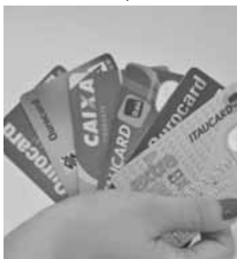
Consumidor deve ficar atento. Juros dos cartões de crédito são de 459,53% ao ano.

Na rolagem da dívida, a taxa ao mês atingiu 15,43%. A segunda modalidade mais onerosa ao consumidor continua sendo o cheque especial com taxa mensal de 12,56% e 313,63% ao ano, tendo sido corrigida em 0,40%. A maior elevação do período foi constata no empréstimo pessoal junto a financeiras que estavam cobrando 8,35% ao mês e 161,79% ao ano, um aumento de 0,95%. E o que levou a estabilidade da taxa média foi o recuo no empréstimo pessoal bancário de 1,28% .