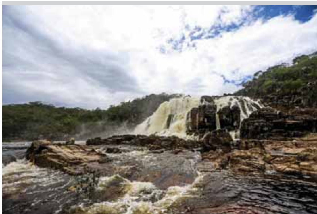
Cachoeira dos Cariocas, no Parque Nacional da Chapada dos Veadeiros.