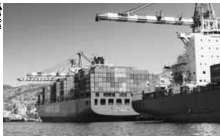
Um cargueiro em Valparaíso (Chile), se prepara para zarpar.

Além disso, de acordo com o relatório, essa queda aconteceu principalmente nas exportações para países da própria região (-11%), para a China (-5%), para os Estados Unidos (-5%) e para a Europa (-4%). Outra informação importante do documento é que nem todos os países da América Latina e do Caribe sentiram essa diminuição da mesma forma. As nações mais afetadas foram a Venezuela (-32%), que passa por uma grave crise