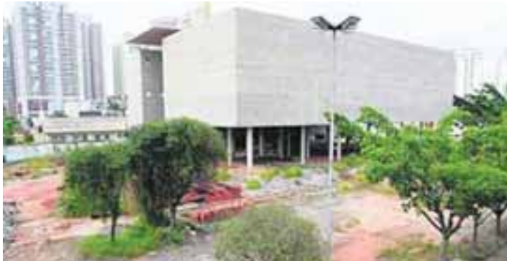
Museu do Trabalho, na região central de São Bernardo.