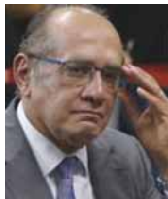
Ministro do STF, Gilmar Mendes.

"Isto é muito sério. O vazamento seletivo, antes de chegar