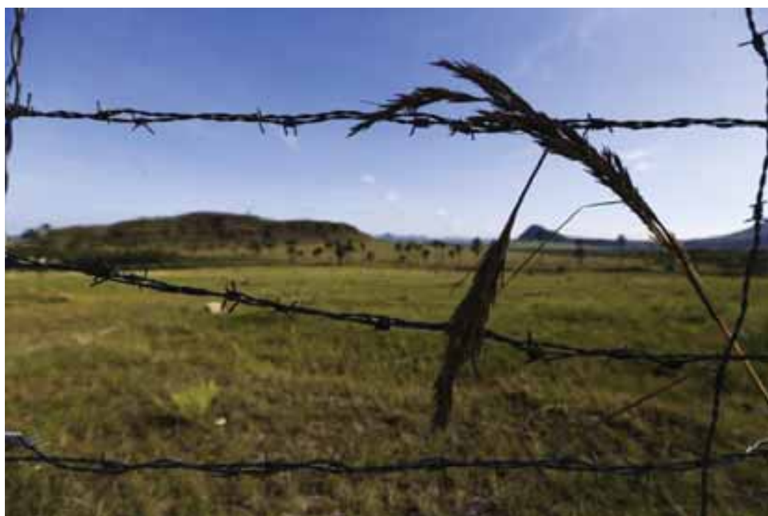
Cerca em área conhecida como Jardim de Maytree estabelece atual limite do Parque Nacional da Chapada dos Veadeiros.

A pesquisadora e professora da UnB Mercedes Bustamante destaca que, por causa das mudanças climáticas, “as áreas de altitude estão entre as mais vulneráveis e devem ter sua proteção priorizada”, como é o caso de parte da Chapada dos Veadeiros, que chega aos 1,6 mil metros de altitude em alguns pontos ainda não abarcados pelo parque nacional.