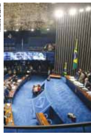
O Senado aprovou em segundo turno, a PEC do Teto dos Gastos Públicos.

"Se não tiver coragem, por que vou reduzir os gastos em dois anos e pouco [período para o fim do mandato]? Para que mexer na Previdência? Poderia deixar para depois, para que outro cuide do país todo atrapalhado e desarticulado. Mas esta não é a missão de quem deve tudo ao Brasil e de quem ama o Brasil", afirmou o presidente, ao discursar durante evento que anunciou o Programa de Renovação de Frota do Transporte Público Coletivo Urbano.