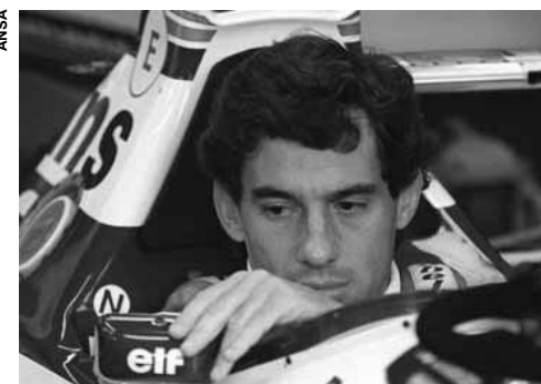
Obra ficará a poucos metros da curva que vitimou o piloto.

O trabalho será voluntário, mas Kobra pediu permissão ao Instituto Ayrton Senna para fazer o painel. “Se eles não aprovas-