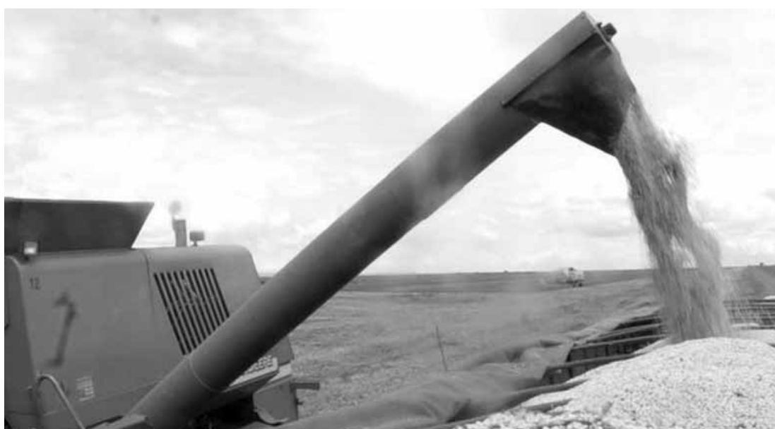
O arroz, o milho e a soja correspondem a 92,4% da safra e ocupam 87,4% da área colhida.

Consequentemente, as regiões Centro-Oeste (45,2%)