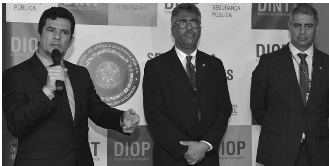
O ministro da Justiça e Segurança Pública, Sergio Moro, inaugura o Centro Integrado de Inteligência de Segurança Pública Nacional, no ministério.

A unidade de inteligência é composta por agentes das polícias civis e militares, órgãos federais e outras instituições especializadas no combate às organizações criminosas, como o Ministério Público e o Poder Judiciário. Esse é o segundo centro de integrado de inteligência. O primeiro, voltado para a Região Nordeste, foi inaugurado no ano passado, em Fortaleza, pelo então ministro da Segurança Pública, Raul Jungmann. Na próxima semana, Moro inaugura, em Curitiba,