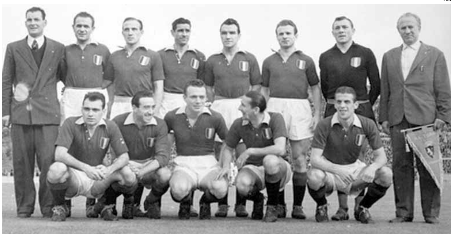
Acidente dizimou quase todo o poderoso elenco do Torino.

A Tragédia de Superga completou neste sábado (4) 70 anos. O Torino, que na época era o clube italiano mais poderoso, perdeu quase todo o seu elenco no acidente aéreo e nunca mais voltou a ter a mesma força de antes