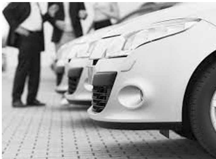
O número de reservas cresceu cerca de 30% em 2018.

Segundo a Rentcars.com, uma das líderes globais em aluguel de carros online, o número de reservas cresceu cerca de 30% em 2018 em relação ao ano anterior. No entanto, ao mesmo tempo que a demanda cresce, o locatário tem passado menos dias em posse do veículo em algumas regiões relevantes do país. Em São Paulo, por exemplo, a média de diárias diminuiu em 13,3%, assim como no Rio de Janeiro, Porto Alegre e Re-