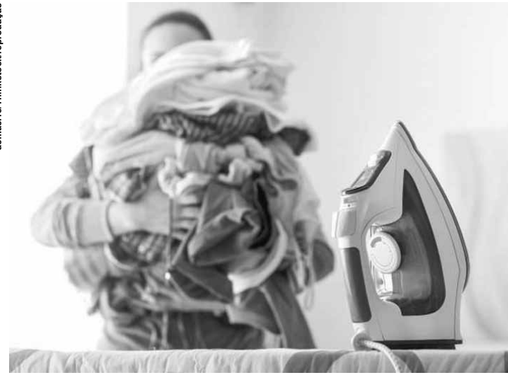
A população que mais realiza afazeres domésticos está na faixa etária de 25 a 49 anos de idade.

A população que mais realiza afazeres domésticos está na faixa etária de 25 a 49 anos de