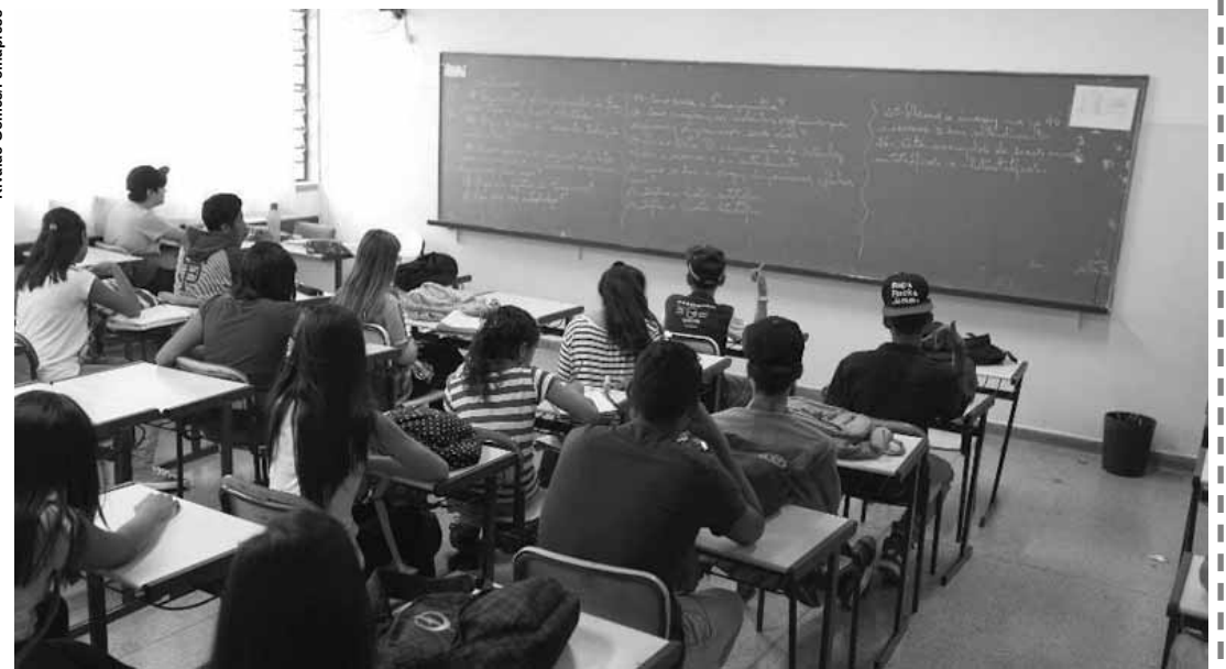
Alunos e professores terão pausas ao término de todos os bimestres.

O próximo ano letivo começa no dia 3 de fevereiro, com encerramento previsto para 22 de dezembro. O objetivo