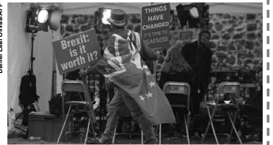
Daniel Iain O'Hara/PAF

Considerando apenas o quarto trimestre, a alta foi de 0,2%, mas levando em conta somente o mês de dezembro, a economia britânica registrou queda de 0,4%, influenciada pela redução dos investimentos. As incertezas aumentaram após o Parlamento do Reino Unido rejeitar o acordo fechado entre a primeira-ministra Theresa May e a UE. Como o bloco se recusa a renegociar o tratado, aumentou a perspectiva de um rompimento abrupto e imediato em 29 de março próximo, o que pode provocar graves danos à economia britânica e uma severa crise de abastecimento.