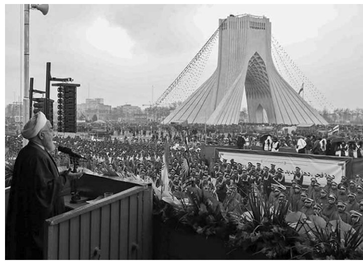
Na praça Azadi, símbolo da revolta de 1979, os manifestantes entoaram o slogan "morte à América", na presença do presidente Hassan Rohani.

O país persa é alvo de novas sanções dos Estados Unidos, que, sob o governo de Donald