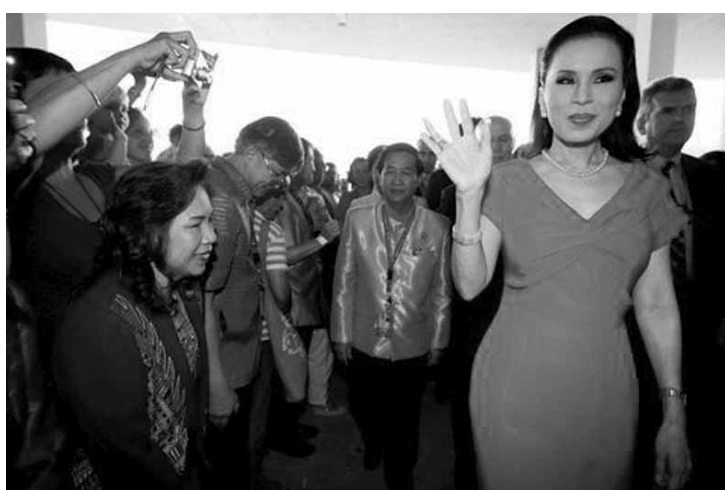
Princesa Ubolratana Mahidol é irmã do rei Vajiralongkorn.

O general Prayuth Chan-ocha, no poder desde agosto de 2014, é o favorito para vencer as eleições. Ele representa o partido Palang Pracharat, criado para ser o braço político das Forças Armadas. Ubolratana, 67 anos, renunciou ao título de princesa em 1972, ao se casar com um americano de quem se divorciaria 26