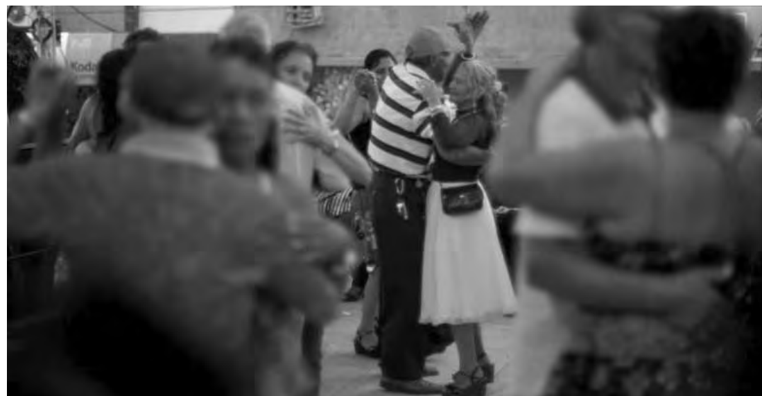
Atividades físicas e sociais praticadas por idosos e pacientes com Alzheimer, ajudam a retardar a perda da memória.

O experimento durou quatro meses e, após esse período, eles foram submetidos à avaliação de atividade motora, por meio de sensores, e de memória espacial, com um teste