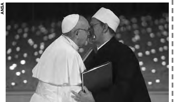
Papa Francisco discursou em Abu Dhabi, em fórum inter-religioso.

Ao fim do discurso, Francisco assinou o documento conjunto do encontro. A cúpula inter-religiosa era o principal evento da viagem